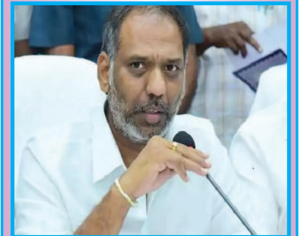
(షణ్ముఖ వెలుగు, ఒంగోలు, మార్చి 28)

ఆయా రాష్ట్రాల్లో డిస్కంల ఆర్థిక పరిస్థితులపై చర్చ