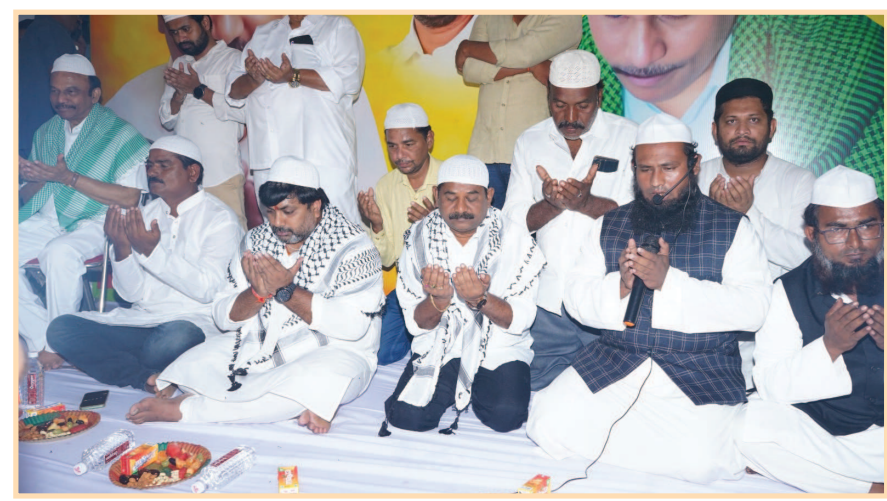
(షణ్ముఖ వెలుగు, కొండవీడు ఇన్ఫార్మి, మార్చి 28)

సింగరాయకొండలో ఇఫ్తార్ విందులో పాల్గొన్న మంత్రి డోలా, ఎంపీ మాగుంట, మ్యారిటీంగ్ బోర్డు చైర్మన్ చైర్మన్ దామచర్ల సత్య