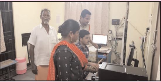
(షణ్ముఖ వెలుగు, పొదిలి, మార్చి 28)

నేర చరిత్ర కలిగిన వారికి పోలీస్ స్టేషన్లో ఎన్ఐఐ వి వేమన శుక్రవారం సాయంత్రం కౌన్సెలింగ్ నిర్వహించారు. భవిష్యత్తులో ఎలాంటి నేరాలకు పాల్పడినా కఠిన చర్యలు తప్పవని ఆయన హెచ్చరించారు. నేర చరిత్ర కలిగిన వారి వేలిముద్రలు తీసుకుని డేటా బేస్ లో నిక్షిప్తం చేసినట్లు ఎన్ఐఐ వేమన తెలిపారు.