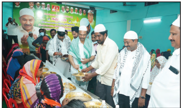
సోదరీ మానవునికి మేలు చేయాలని ఖురాన్ చెప్పింది. ముస్లిం మైనార్టీల అభివృద్ధి కుటుంబ ప్రభుత్వ ధ్యేయం. బద్వేల్లో ముస్లిం మైనార్టీల