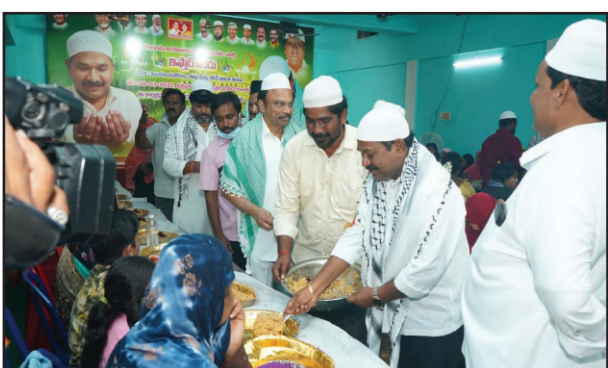
సంక్షేమానికి రూ.5,434 కోట్లు కేటాయించాం. హాజీ యాత్రకు రూ.14 కోట్లు కేటాయించాం. ఇమామ్లు, మౌలానాలుకు ప్రతినిలా గౌరవ