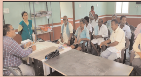
(షణ్ముఖ వెలుగు, పొదిలి, మార్చి 25)