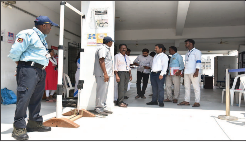
కావడం జరిగిందని, 425 మంది పరీక్షకు హాజరుకాలేదు. అలాగే మధ్యాహ్నం జరిగిన పరీక్షకు 475 మంది అభ్యర్థులు హాజరు కావట్టినట్లుగా, 215 మంది హాజరు కావడం జరిగిందని, 260 మంది పరీక్షకు హాజరుకాలేదు.