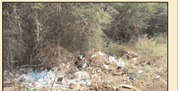
(షణ్ముఖ వెలుగు, హొన్నూరు, మార్చి 25)

నూతనంగా చేపట్టిన స్థానిక ఆశ్రమ పాఠశాలకి ఒకవైపు తహసీల్దార్ కార్యాలయం మరోవైపు ప్రాథమిక వైద్యశాల అలాగే రైతు భరోసా కేంద్రం సమీపంలో జూనియర్ కళాశాల ఉన్నాయి. నిత్యం ఆయా కార్యాలయాలకు ప్రజలు వస్తుంటారు. ఈ కార్యాలయ చుట్టూ చిల్ల చెట్లు, పిచ్చి మొక్కలు నిండి ఉన్న దీనిపై ఆ శాఖ అధికారులు ఎవరూ పట్టించుకోవడం లేదు. ఎప్పుడు ఏదో ఒక పని మీద కార్యాలయానికి, ప్రభుత్వ ప్రాథమిక వైద్యశాలకి తహసీల్దార్ కార్యాలయానికి, మండల పరిషత్ కార్యాలయానికి నిత్యం ప్రజలు వస్తుంటారు. చిల్ల చెట్లు, పిచ్చి మొక్కలు ఎక్కువగా ఉండటం వలన విష సర్పాలు, తేళ్లు ఉండి కార్యాలయాల చుట్టూ సంచరిస్తున్నాయని ప్రజలు వాపోతున్నారు. ఆయా శాఖ అధికారులు పట్టించుకోని చిల్ల చెట్లు, పిచ్చి మొక్కలు తొలగించాలని ప్రజలు కోరుతున్నారు.