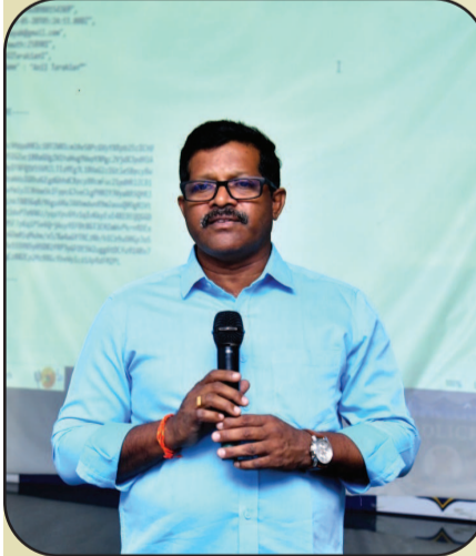
వివరించారు. ప్రస్తుత సమాజంలో ప్రజలు ఎక్కువగా సైబర్ నేరాల బారిన పడుతున్న నేపథ్యంలో సిబ్బంది సాంకేతిక పరిజ్ఞానాన్ని పొందించుకోవాలన్నారు. ఓ.టి.పి నేరాలు, ఆన్ లైన్ మోసాలు, ఓ.టి.పి లేకుండా చేసే మోసాలు, ఉద్యోగాల పేరిట ఎర వేసి ప్రజలను మోసం చేసే వారిని, ఇతర సైబర్ మోసాలకు పాల్పడే నేరగాళ్ళను సాక్షాత్కారాలతో కఠిన శిక్షలు పడేలా చూడాలన్నారు. పిటిషన్ మేనేజ్మెంట్, ఎఫ్.ఐ.ఆర్ మేనేజ్మెంట్, స్టేషన్ మేనేజ్మెంట్, ఈ కోర్ట్ లు, క్రిమినల్ ఇంటెలిజెన్స్ సిస్టం తదితర అంశాల్లో మోక్షులను నేర్పిస్తారన్నారు. సిసిటిఎన్ఎస్లో ఎఫ్ఐఆర్ మొదలు ముద్రాయిలకు శిక్షపడే అంతా వరకు సంధించిన డాక్యుమెంట్స్ అప్లోడ్ ఏ విధంగా చేయాలో శిక్షణలో నేర్పిస్తారన్నారు. సైబర్ మోసాలకు గురైన వారికి 1930 లోల్ ఫ్రీ నెంబర్ ద్వారా ఫిర్యాదు చేయడంపై ప్రజలకు విస్తృతంగా అవగాహన కల్పించాలని సూచించారు. భౌతిక పోలీసింగ్ తో పాటు డిజిటల్ పోలీసింగ్ పై అవగాహన కలిగి ఉండాలని, సి.సి.టి.ఎన్.ఎన్, ఈ-కాప్స్ పై పట్టు సాధించాలన్నారు. ఈ శిక్షణలో కంభం సీబి మల్లికార్జున రావు, ఒంగోలు వన్ టౌన్ సీబి నాగరాజు, కొండేపి సీబి సోమశేఖర్, ఎస్.బి.సిబ్బంది పాల్గొన్నారు.