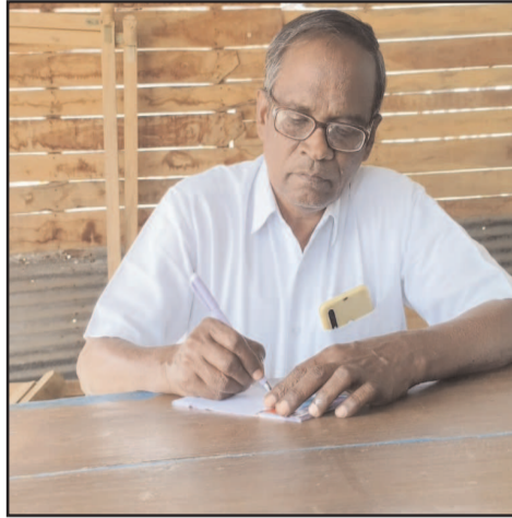
(షణ్ముఖ వెలుగు, ఒంగోలు, మార్చి 25)