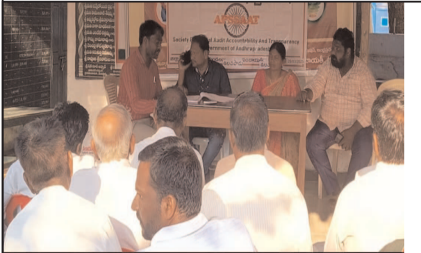
(షణ్ముఖ వెలుగు, ఉలవపాడు, మార్చి 25)