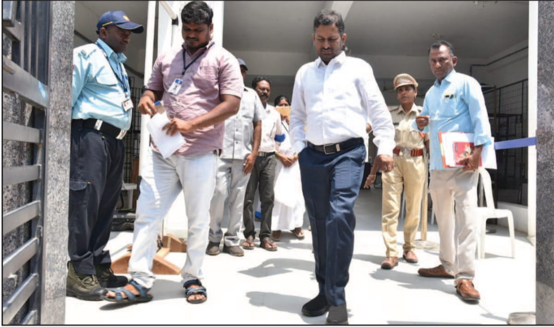
(షణ్ముఖ వెలుగు, ఒంగోలు, మార్చి 25) ఏపిపిఎస్సి పరీక్షలకు హాజరగు అభ్యర్థులకు అసౌకర్యం కలగకుండా అన్ని ఏర్పాట్లు చేయాలి