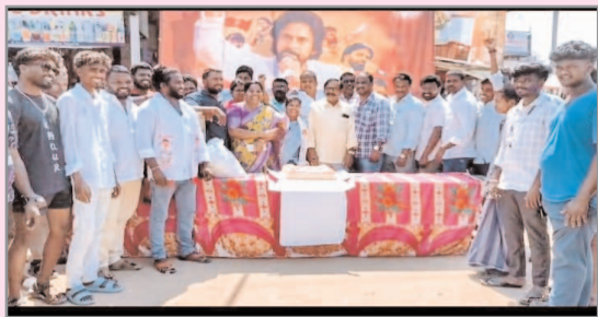
(షణ్ముఖ వెలుగు, సత్తువేడు, మార్చి 14)