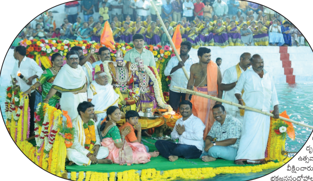
(షణ్ముఖ వెలుగు, పొదిలి, మార్చి 13)