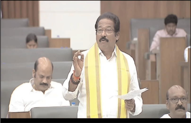
రూ. 230 వరకు అమ్మారని, బెల్ట్ షాపులో మల్లీ రూ.50 అదనంగా ఇచ్చినందుకు సీఎం చంద్రబాబుకు ధన్యవాదాలు తెలిపారు. బాదారని గుర్తు చేశారు. డిజిటల్ లావాదేవీలు అనుమతించకుండా

- జగన్ అక్రమంగా దోచిన వేలకోట్లు - రికవరీ చేసి ప్రజలకు ఖర్చుపెట్టాలి ప్రభుత్వ చీఫ్ ఎన్ జీవీ ఆంజనేయులు