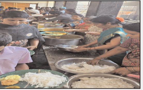
(షణ్ముఖ వెలుగు, కనిగిరి, మార్చి 13)