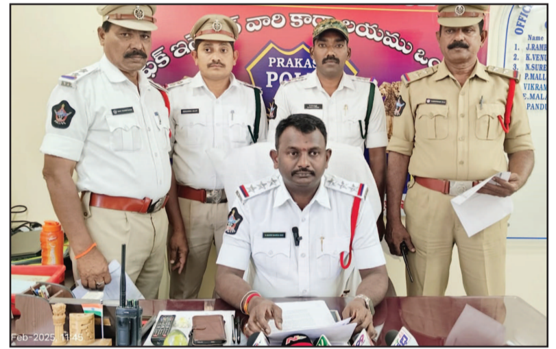
స్టేషన్లో తెలిపారు. ఈ నెల 1వ తేదీ నుంచి కొత్త చలానాలు అమలులోకి వస్తున్నందున ప్రజలందరూ విధిగా ట్రాఫిక్ రూల్స్