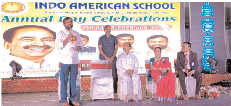
మేకల స్కూలు యాజమాన్యం విద్యార్థుల తల్లిదండ్రులు ప్రజాప్రతినిధులు పాల్గొన్నారు.

విద్యార్థులను సామాజిక అంశాలపై చర్చించడం ద్వారా వారిలో భయం పోతుందన్నారు. ఇలాంటి వేడుకలు స్కూల్ యాజమాన్యం నిర్వహించడం ద్వారా విద్యార్థులు ఎంతో ఉత్సాహంగా, ఉల్లాసంగా ఉంటారని తెలిపారు. ఈ కార్యక్రమానికి ముఖ్య అతిథిగా వచ్చిన ఎంపీ ఈటెల రాజేందర్ కు ప్రత్యేక ధన్యవాదాలు తెలిపారు. కార్యక్రమంలో ప్రజాప్రతినిధులు పాల్గొన్నారు.