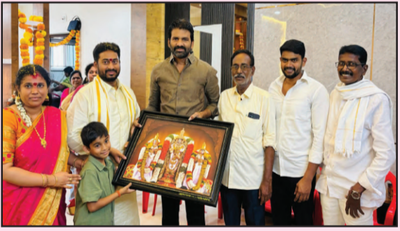
(షణ్ముఖ వెలుగు, నెల్లూరు, ఫిబ్రవరి 17)