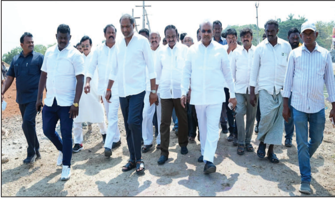
(షణ్ముఖ వెలుగు బ్యూరో, పల్నాడు, ఫిబ్రవరి 17)

భక్తుల రద్దీని క్రమబద్ధీకరించేందుకు ప్రత్యేక ప్రణాళిక రాష్ట్ర పండుగ హోదాలో మహా శివరాత్రి వేడుకలు గత ఐదేళ్లుగా పవిత్ర శైవక్షేత్ర నిర్వహణను పట్టించుకోని వైసీపీ సీఎం చంద్రబాబు నేతృత్వంలో కోటప్పకొండకు పూర్వ వైభవం పల్నాడు జిల్లా ఇన్స్పెక్టర్ మంత్రి గొట్టిపాటి రవికుమార్