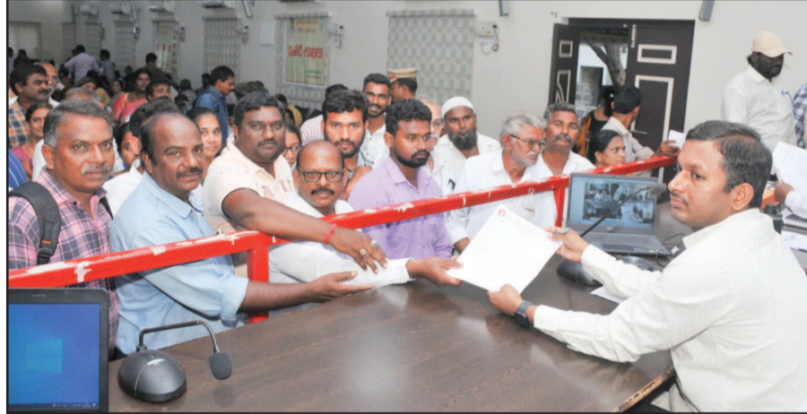
(షణ్ముఖ వెలుగు, ఒంగోలు, ఫిబ్రవరి 17)

జర్నలిస్టుల సమస్యలపై జేసీకి వినతి పత్రం అందచేసిన డిజిఎఫ్ సభ్యులు ఒంగోలులో జర్నలిస్టులకు శాశ్వత ప్రెస్ క్లబ్ ఏర్పాటు చేయాలి రాష్ట్రంలో జరుగుతున్న జర్నలిస్టుల పై దాడులను అరికట్టాలి అక్రిడేషన్ కమిటీలో డెమోక్రటిక్ జర్నలిస్ట్ ఫోరం సభ్యులకు అవకాశం కల్పించాలి విద్యార్థులకు ఫీజులతో సంబంధం లేకుండా హాల్ టికెట్ ను అందజేయాలి హాల్ టికెట్ల సమస్యలపై కాలేజీ ప్రాంగణంలో కరపత్రాలతో పాటు టోల్ ఫ్రీ నెంబర్ ను వెంటనే విడుదల చేయాలి అధికారులకు జేసీ ఆర్ గోపాలకృష్ణ ఆదేశం