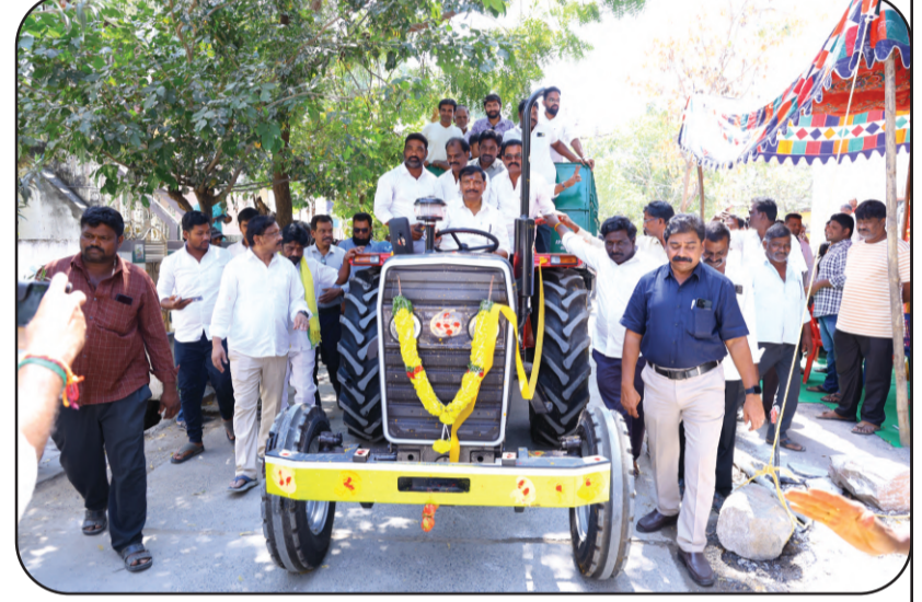
(షణ్ముఖ వెలుగు, పొదిలి, ఫిబ్రవరి 16)