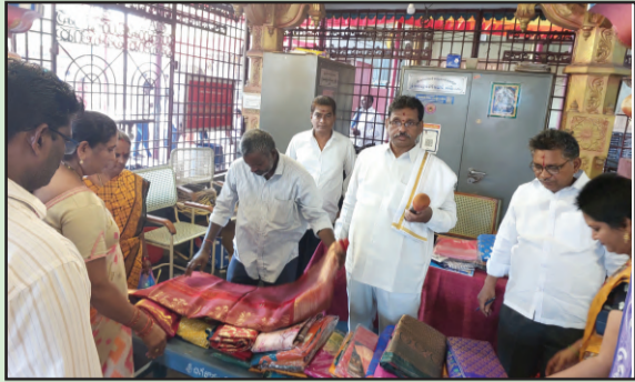
(షణ్ముఖ వెలుగు, బాపట్ల, ఫిబ్రవరి 16)