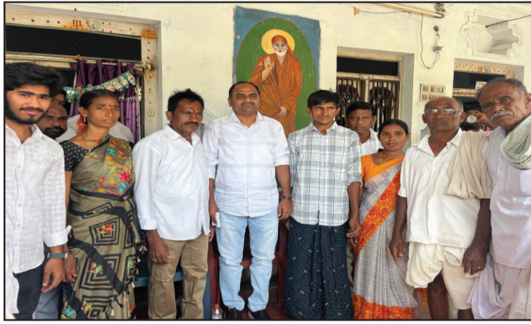
(షణ్ముఖ వెలుగు, పెద్దారవీడు, ఫిబ్రవరి 16)