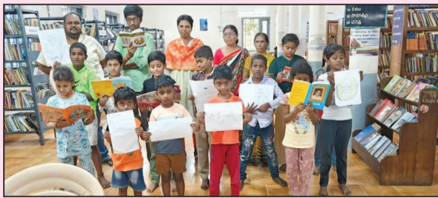
(షణ్ముఖ వెలుగు, ఒంగోలు, ఫిబ్రవరి 16)