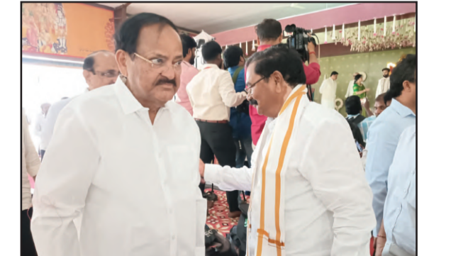
(షణ్ముఖ వెలుగు, నెల్లూరు, ఫిబ్రవరి 16)