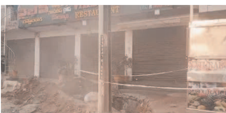
భూగర్భంలో గ్యాస్ పైప్ లైన్ ఏర్పాటు చేసినప్పుడు గుర్తింపు చిహ్నాలు పెడితే ఇలాంటి ఘటనలు జరిగేవి కావని స్థానికులు అంటున్నారు.

లైన్ పగిలినదన్న సమాచారం తెలియగానే భాగ్యలక్ష్మీ గ్యాస్ లిమిటెడ్ కు చెందిన ప్రతినీధులు హుటాహుటిన ఘటనాస్థలికి చేరుకుని వెంటనే మరమ్మత్తు పనులు చేపట్టారు. వీలైనంత తక్కువ సమయంలోనే లీకేజీని అరికట్టారు. దీంతో స్థానికులు ఊపిరిపీల్చుకున్నారు. అయితే.. సూరారం కాలనీ వరసర ప్రాంతాల్లో తరచూ భాగ్యలక్ష్మీ గ్యాస్ లిమిటెడ్ కంపెనీ సుంచి గ్యాస్ లీకవ్వడం పరిపాటిగా మారిందని ఆందోళన వ్యక్తం చేశారు.