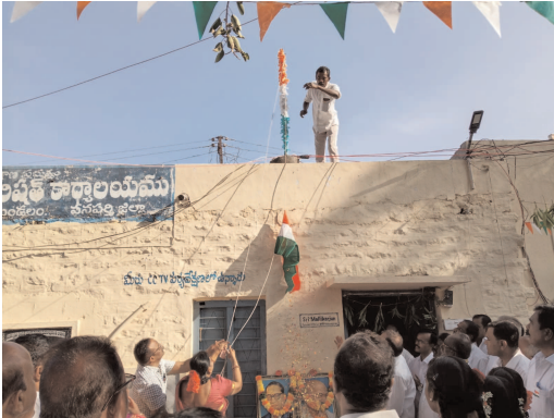
అధికారులపై చర్యలు చేపట్టాలని మండలం ప్రజలు కోరారు.

అంటూ సర్వత్రా విమర్శలు వెల్లువెత్తుతున్నాయి. గోడకు కిందనే ఎగురవేసి జాతీయ జెండాను అవమాన పరిచారు నిబంధనలు ఉల్లంఘించారు. జాతీయ జెండాను ఎగురవేసే సందర్భాల్లో పాటించే నిబంధనల్లో పొరపాట్లు, తప్పులు, ఉల్లంఘనలకు పాల్పడితే, చట్ట ప్రకారం శిక్షార్హులు అవుతారని మేధావులు అంటున్నారు. భారత దేశానికి ఎందరో మహాత్ముల ప్రాణ త్యాగాలతో సంపాదించుకున్న స్వాతంత్ర్య చిహ్నాన్ని అగౌరవ పట్టడం ఆవిష్కరించడం విమర్శకు కారణమైంది. భాద్యత గల అధికారులు జెండా ఆవిష్కరణలో నిర్లక్ష్యం వహించడం భారత దేశానికే అవమానమని మండల ప్రజలు చర్చించుకుంటున్నారు. ఇలాంటి సంఘటనలు పునరావృతం కాకుండా సంబంధిత