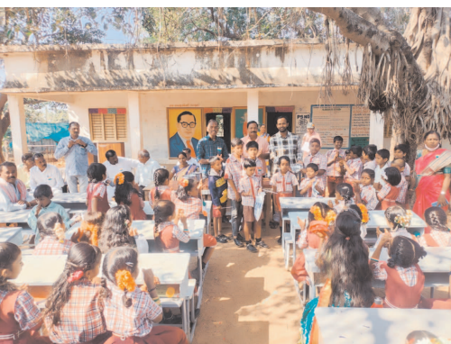
చూడాలని జై జవాన్ జై కిసాన్ అనే నినాదాలు చేస్తూ మన రాజ్యాంగం శిల్పి డాక్టర్ బి.ఆర్. అంబేద్కర్ కలలు కన్న మానవత్వ సమాజ నిర్మాణానికి అందరం కట్టుబడి ఉండాలని