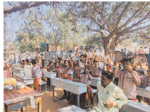
ఆయన ఆకాంక్షించారు. ఆయన ఆలోచన విధానాలలో యువత నడుచుకోవాలని ఆయన ప్రార్థించారు. ఈ కార్యక్రమంలో ప్రజా ప్రతినీధులు, విద్యార్థి విద్యార్థినిలు మరియు గ్యాస్ ఏజెన్సీ సిబ్బంది తదితరులు పాల్గొన్నారు.