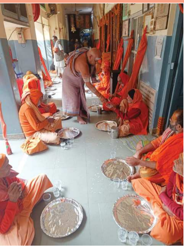
(షణ్ముఖ వెలుగు, ఒంగోలు, డిసెంబర్ 2) భూ కైలాసం వారణాసిలో యతి, నారాయణ సేవలు అత్యంత వైభవోపేతంగా జరిగాయి.