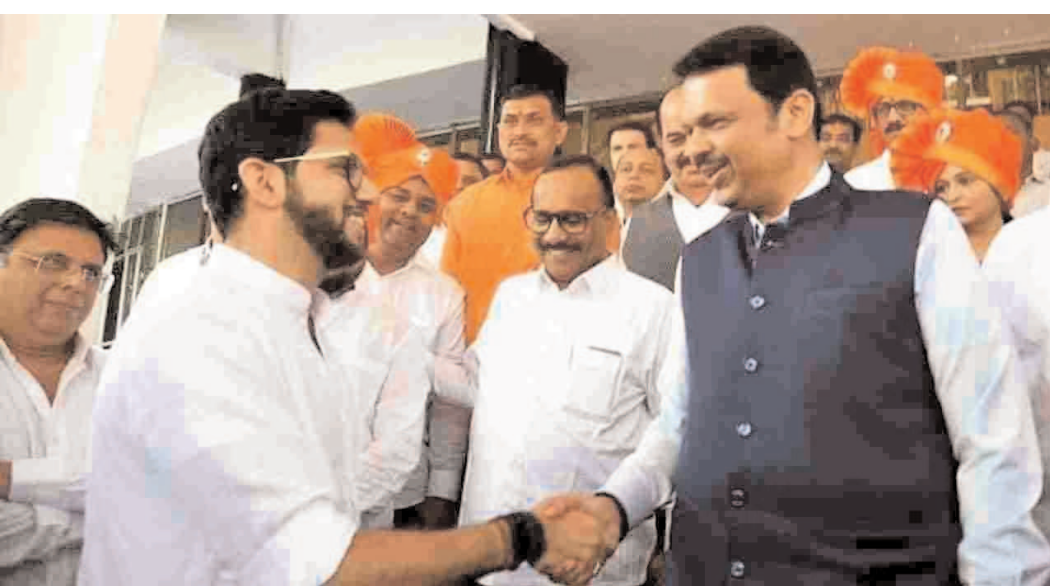
నేత ఛగన్ భుజబల్ విమర్శించారు. సభలో ప్రమాణస్వీకారం చేసినప్పుడే సభా కార్యక్రమాల్లో ఎమ్మెల్యేలు పాల్గొనగలుగుతారని అన్నారు. కాగా, మహారాష్ట్ర అసెంబ్లీ స్పీకర్ ఎన్నిక డిసెంబర్ 9న జరుగనుంది.