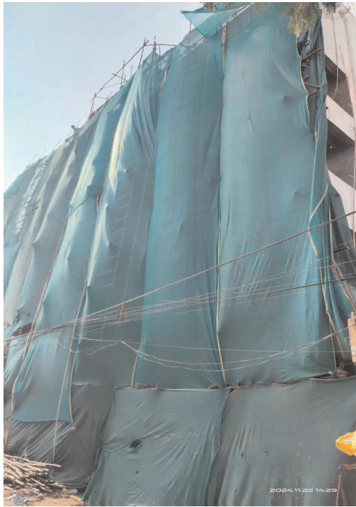
అవుతుందంటున్నారని స్టానికలు. టౌన్ ప్లానింగ్ అధికారులకు మామూళ్లు అందితే అక్రమ నిర్మాణాలను కూల్చలేని, మామూళ్లు అందకపోతే వెంటనే కూల్చుతారని తీవ్ర విమర్శలు ఉన్నాయి. ఎస్పీ వద్దకు ఫిర్యాదులు ఎన్ని ఇచ్చినా...