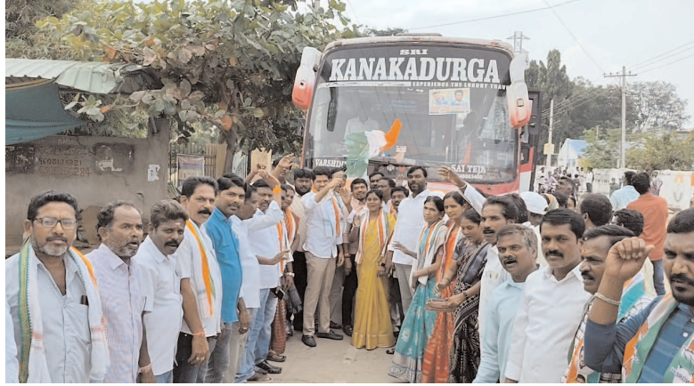
- పెద్దపల్లిలో కాంగ్రెస్ యువ వికాస సభ... - సభకు తరలించిన యువత, రైతులు...

షణ్ముఖ వెలుగు హుజూరాబాద్ రూరల్ ప్రతినీధి డిసెంబరు 04: ఏడాదిలో కాంగ్రెస్ ప్రభుత్వం చేసిన పనులు తెలుపుతూ, నిరుద్యోగులు, రైతుల గురించి ఆలోచించి అటు నిరుద్యోగులకు భరోసా ఉద్యోగ నియామక పత్రాలు అందజేస్తూ, రైతుల సంక్షేమ ధ్యేయంగా ముందుకు వెళు