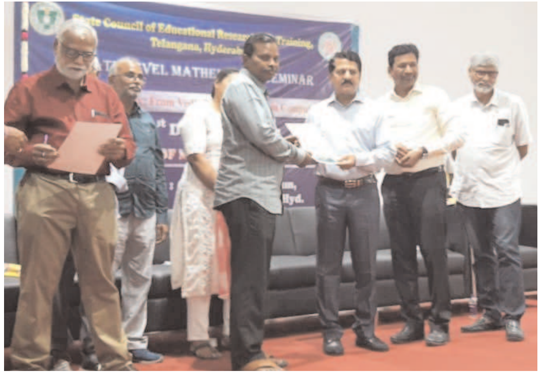
బోధించవచ్చు. డిజిటల్ ఉపకరణాల ద్వారా తక్కువ డిజిటల్ ఉపకరణాలు మంజూరు చేసి గణిత ఉపాధ్యాయులు సమయంలో విద్యార్థులకు నాణ్యమైన విద్య అందరికీ శిక్షణ ఇవ్వడం ద్వారా విద్యార్థుల్లో గణితం పట్ల ఆసక్తి,అభిరుచి ని పెంపొందించవచ్చు అందించవచ్చు.విద్యా శాఖ మిగిలిన పాఠశాల లకు కూడ