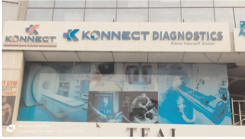
పేషెంట్ రిపోర్టులు తారుమారు... డయాగ్నోస్టిక్ సెంటర్ పక్క బాధితుడి ఆందోళన