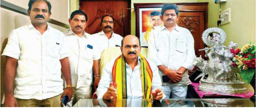
(షణ్ముఖ వెలుగు, మాచర్ల టౌన్, డిసెంబర్ 7)