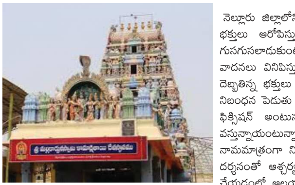
(ఉజ్జ్వల వెలుగు, నెల్లూరు, డిశంబర్ 7)

భక్తులు లేక వెలవెలబోతున్న జొన్నవాడ కామాక్షి తాయి ఆలయం