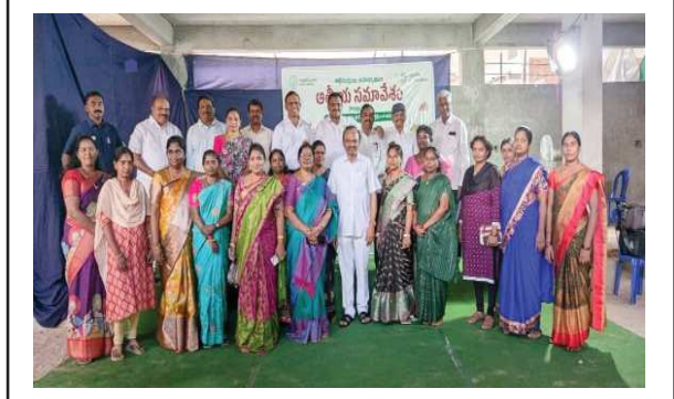
(షణ్ముఖ వెలుగు, ఒంగోలు, డిసెంబర్ 7)