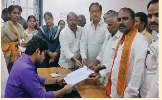
(షణ్ముఖ వెలుగు, మార్కాపురం ఇన్ఫార్మ్, డిసెంబర్ 4)