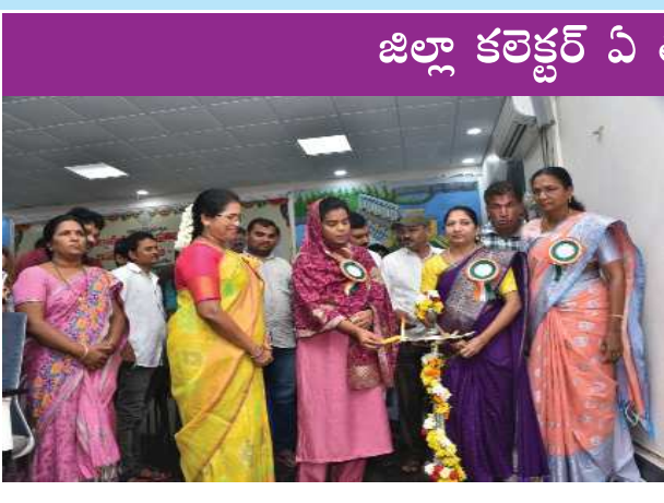
జిల్లా కలెక్టర్ ఏ తమీమ్ అన్సారియా