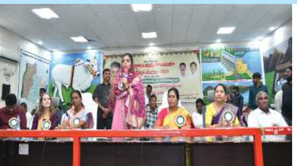
(షణ్ముఖ వెలుగు, ఒంగోలు, డిసెంబర్ 3)