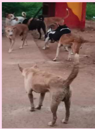
(షణ్ముఖ వెలుగు, ఉలవపాడు, డిశంబర్ 3)

మండల కేంద్రమైన ఉలవపాడు మేజర్ గ్రామపంచాయతీ నడి బొడ్డున పలు వీధులలో కుక్కలు స్వేచ్ఛ విహారం చేస్తున్నప్పటికీ గ్రామపంచాయతీ అధికారులు చూసి చూడనట్లు వ్యవహరిస్తున్నారని గ్రామ ప్రజలు ఆవేదన వ్యక్తం చేస్తున్నారు అయితే ఈ నేపథ్యంలో భాగంగా మెయిన్ రోడ్ సెంటర్లో పలు వీధుల్లో రాత్రి వగలు తేదా లేకుండా వాహనదారులను పాదాచారులను కుక్కలు వెంటబడి తరుము తుండడంతో ఏ క్షణంలో ఎటువైపు సుంచి కుక్క కాటుకు గురి అవుతామో అని ప్రజలు ఆందోళన వ్యక్తం చేస్తున్నారు. కోనేరు పరిసర ప్రాంతాల్లో పుట్టగిడుగుల్లా సునకాలు నడి రోడ్లమీద మీద పైరా విహారం చేస్తున్నప్పటికీ వీటిని నియంత్రించే విషయంలో గ్రామపంచాయతీ అధికారులు ప్రేక్షక పాత్ర పోషించడం కొనమెరుపు ఈ విషయంపై గ్రామపంచాయతీ కార్యదర్శి, సర్పంచ్ పంచాయతీ పరిధిలోని సునకాలను నియంత్రించేందుకు తక్షణమే చర్యలు చేపట్టవలసిన అవసరం ఎంతైనా ఉంది అని గ్రామ ప్రజలు ఆవేదన వ్యక్తం చేస్తున్నారు.