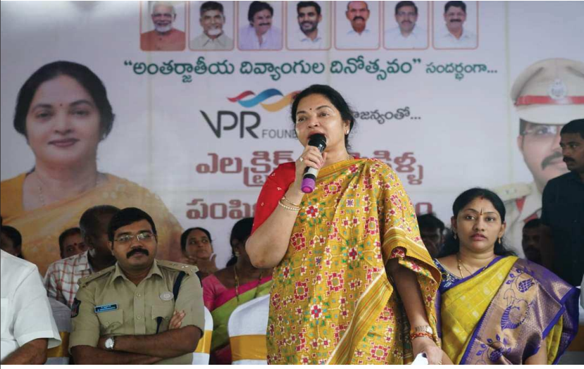
(షణ్ముఖ వెలుగు, నెల్లూరు, డిసెంబర్ 3)