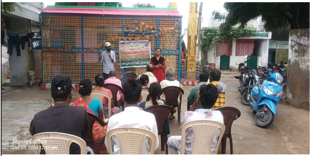
(షణ్ముఖ వెలుగు, పెద్దారవీడు, డిసెంబర్ 3)

సహాయం అందించడం మరియు వాతావరణ అంశాల ఆధారముగా సంభవించిన పంట సమస్యను అంచనా వేసి బీమా పరిహారం చెల్లించడం మరియు ఎంపిక చేసిన పంటలను సాగుచేస్తూ నిర్ణీత సమయములో ప్రీమియం చెల్లించి నమోదు చేసుకున్న కవులు రైతులతో సహా రైతులందరూ ఈ బీమా పథకాలలో చేరడానికి అర్హులే అని ఈ బీమా ఆఖరి ఆఖరి రోజు డిసెంబర్ 15 నా ముగుస్తుంది. అలాగే ఆముదము, శనగ పంట పొలాలకి వెళ్లి పరిశీలించడం జరిగింది. ఆముదం పంట గురించి మాట్లాడుతూ ఆముదం పంటలలో మేల్లైన రకాలు పురుగులు తెగులు నివారణ చర్యలు తెలిపారు. అదేవిధంగా కంభంపాడు గ్రామంలోని శనగ పొలంలో పొలం పిలుస్తుంది కార్యక్రమం నిర్వహించి రైతులతో మాట్లాడుతూ శనగ పంటలలో తెల్ల దోమ పూత మరియు కాయ ఏర్పడే సమయంలో ఉధృత ఎక్కువగా ఉండి దిగుబడిని తగ్గిస్తుంది ఈ పెరుగు నివారణకు డ్రైమిడోవల్ 2ఎంఎల్ లోట్ నైట్ కి పిచికారి చేయాలి. అలాగే ఆముదంలో పొగాకు లద్దె పురుగు , దాసరి పురుగు, పచ్చ దోమ, కొమ్మ, కాయ తొలుచు పురుగుకు ఏ ఏ యాజమాన్య చర్యలు చేయాలి చెప్పారు. పొగాకు లద్దె పురుగు ఆకుల క్రింద గుంపు గుంపులుగా చేరి ఆకులను తిని చేస్తాయి. దీని నివారణకు ఎకరాకు 4 నుంచి 5 లింగాకర్మ బుట్టలు కాసి మోనోకోటోఫస్ 2ఎంఎల్, లీటర్ నీటికి కలిపి పిచికారి చేయాలి. పచ్చ దోమ : ఆకుల అడుగు భాగాన చేరి రసం పీల్చడం వలన ఆకులు ఎండు బారిపోతుంది. ఈ పురుగు నివారణకు ప్రాపిన్ 2 ఎంఎల్ లీటర్ నీటి కలిపి పిచికారి చేసుకోవాలి. తెల్ల దోమ నివారణకు వేప నూనె 5 ఎంఎల్ లీటర్ నీటికి లేదా ఎసిఫేట్ 1.5ఎంఎల్ లీటర్ నీటికి కలిపి పిచికారి చేయాలి. కొమ్మ, కాయ తొలుచు పురుగు ఎక్కువగా పుష్పించే దశలో పురుగు కొమ్మ ,కాయలలో వెళ్లి నాశనం చేస్తుంది. ఈ పురుగు నివారణకు ప్రోపిన్ 2 ఎంఎల్ లీటర్ నీటికి కలిపి పిచికారి చేయాలని వ్యవసాయ అధికారి కె బజ్జి బాయి తెలిపారు.