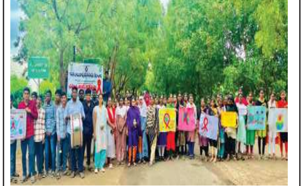
(షణ్ముఖ వెలుగు, కనిగిరి, డిసెంబర్ 1)