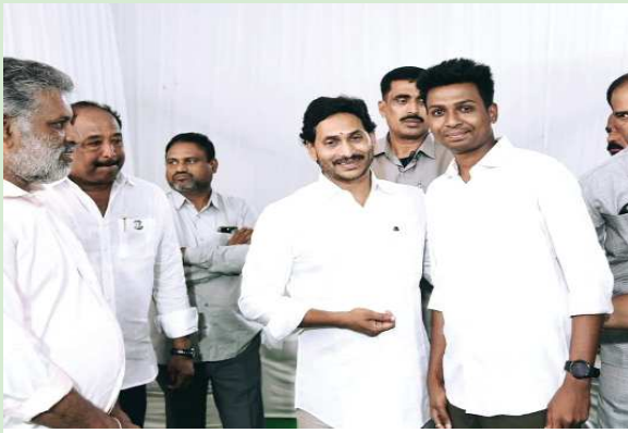
(షణ్ముఖ వెలుగు, పామరూ, డిసెంబర్ 1)

పామరూ పట్టణంలో గురువారం జరిగిన గంధం మహోత్సవ కార్యక్రమానికి విచ్చేసిన ప్రతి ఒక్కరికీ పేరుపేరుగా ధన్యవాదాలు తెలిపారు. ప్రతి ఒక్కరూ సుఖ సంతోషాలతో, ఆయుర్గ్యాలతో ఉండాలని వైఎస్ఆర్ఎస్ పార్టీ నాయకులు కోరారు. ప్రతి సంవత్సరం లాగే ఈ సంవత్సరం కూడా గంధం మహోత్సవానికి తన వంతు సహాయంగా వైఎస్ఆర్ఎస్ పార్టీ నాయకులు గయాజ్ దర్గాకు గంధం, బాణ సంచాలు అందజేశారు.