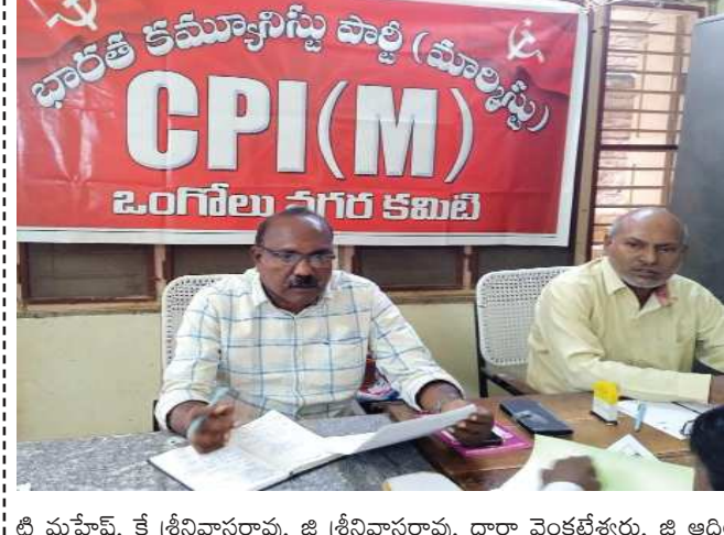
(షణ్ముఖ వెలుగు, ఒంగోలు, డిసెంబర్ 1)