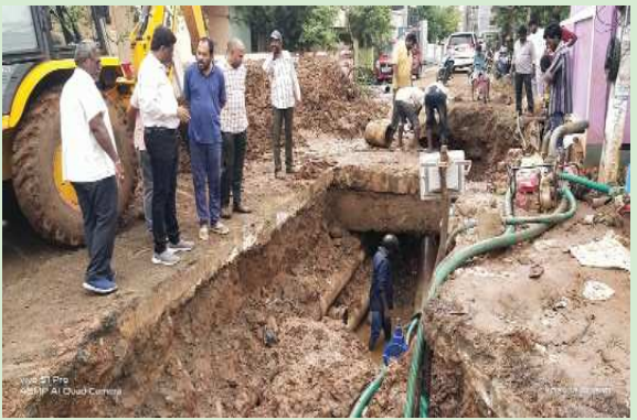
(షణ్ముఖ వెలుగు, ఒంగోలు, డిసెంబర్ 1)

గత కొన్ని రోజులు నుండి భాగ్యనగర్లోని 4వ లైన్లో జరగుతున్న క్రింకింగ్ వాటర్ ఫైన్ లైన్ మున్సిపల్ అధికారులతో కలిసి నగర పాలక కమిషనర్ కోడూరు వెంకటేశ్వరరావు పరిశీలించారు. ఈ సందర్భంగా ఆయన మాట్లాడుతూ ఫైన్ లైన్ వల్ల ప్రజలు ఇబ్బంది పడుతున్నారని, లీకేజీ అవుతున్న ఫైన్ లైన్ కి కొత్త ఫైన్ లైన్ వేస్తున్నట్లు తెలిపారు. దాదాపు మొత్తం ఫైర్ అవడం జరిగిందని, వాటర్ కూడా పదులుతామని కమిషనర్ తెలిపారు.