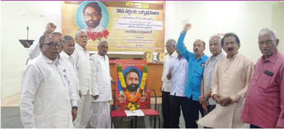
(షణ్ముఖ వెలుగు, ఒంగోలు, డిసెంబర్ 1)