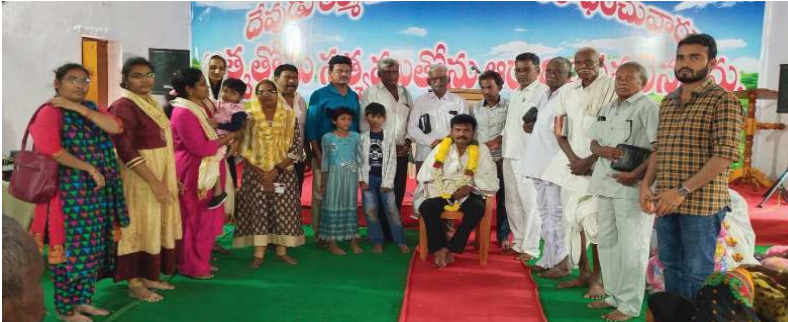
(షణ్ముఖ వెలుగు, మర్రిపూడి, డిసెంబర్ 1)

మర్రిపూడి క్రిస్టియన్ బ్రదర్స్ అసెంబ్లీ చర్చి సంఘాస్తులు