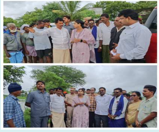
(షణ్ముఖ వెలుగు, సూళ్లూరుపేట ఇంచార్జ్, డిసెంబర్ 1)