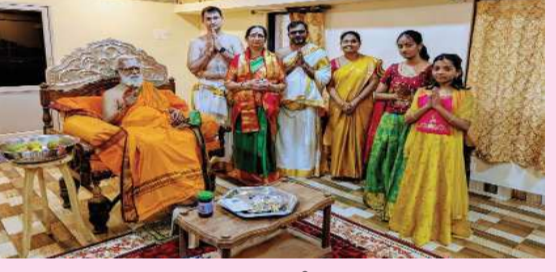
(షణ్ముఖ వెలుగు, ఒంగోలు, డిసెంబర్ 15)