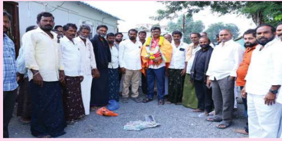
(షణ్ముఖ వెలుగు, పొదిలి, డిసెంబర్ 15)

ఎమ్మెల్యే కందులకు కృతజ్ఞతలు తెలిపిన తీగదుర్తిపాడు నీటి సంఘ సభ్యులు