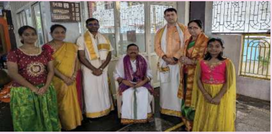
(షణ్ముఖ వెలుగు, ఉలవపాడు, డిసెంబర్ 15)

కుర్తాకం పీఠంలో శ్రీగిరి ధర్మ కర్తల ప్రత్యేక పూజలు