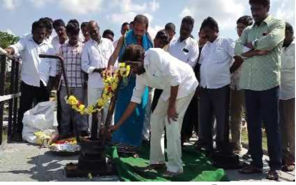
(షణ్ముఖ వెలుగు, నెల్లూరు, నవంబర్ 7)