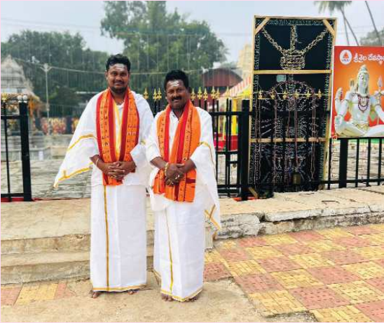
(షణ్ముఖ వెలుగు, ఒంగోలు, నవంబర్ 7)

వేద ఆశీర్వాచనం, తీర్థ ప్రసాదాలు అందజేసిన ఆలయ కమిటీ నిర్వహకులు