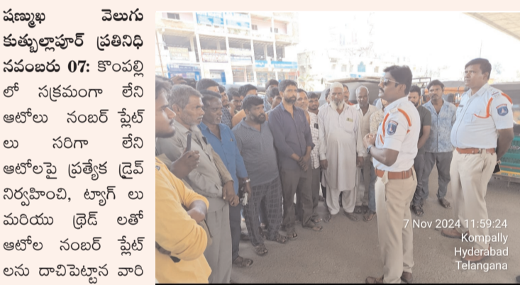
7 Nov 2024 11:59:24 Komally Hyderabad Telangana