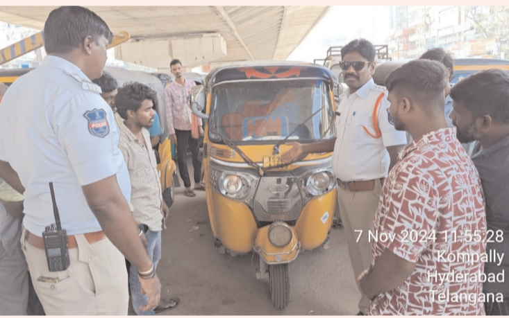
7 Nov 2024 11:55:28 Komally Hyderabad Telangana