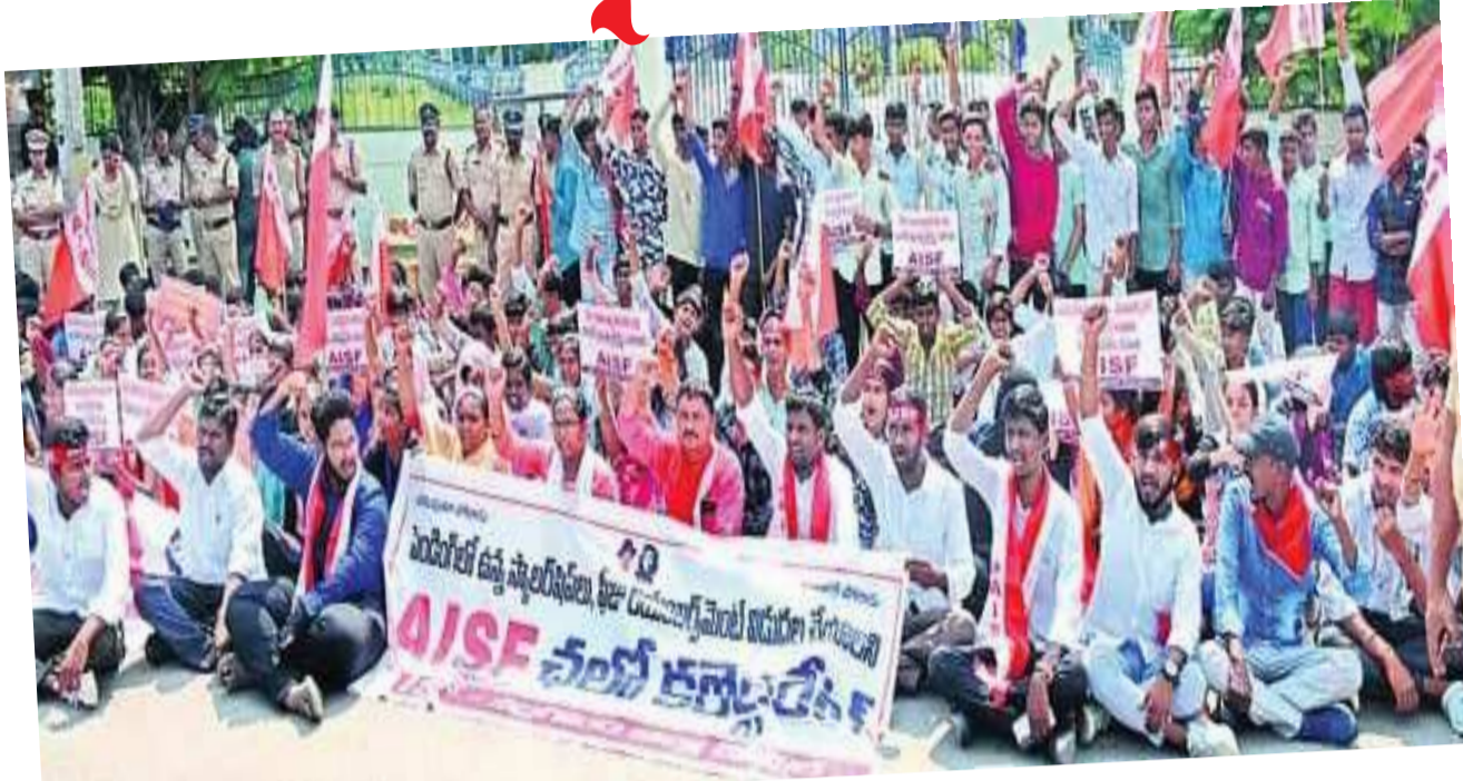
(షణ్ముఖ వెలుగు బ్యూరో, ప్రకాశం, నవంబర్ 6)