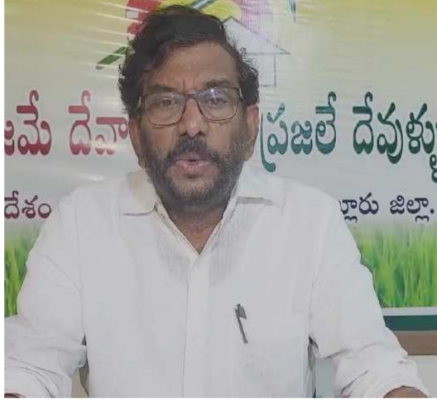
(షబ్దాఖ వెలుగు, నెల్లూరు, నవంబర్ 6)

108 అంబులెన్సుల నిర్వహణకు సంబంధించి ప్రభుత్వం తమకు రూ.141 కోట్లు చెల్లించాలని అరబిందో కంపెనీ చెబుతోంది. అరబిందో కంపెనీ ఏ2 విజయసాయిరెడ్డి వియ్యంకుడి కంపెనీకి ప్రజల సొత్తు దోచిపెట్టిన జగన్ రెడ్డి, తన అబ్బులు రోపితుడు చెందినది. వైసీపీ ప్రభుత్వంలో 108 బాధ్యతలను చేజిక్కించుకున్న అరబిందో కంపెనీ వందల కోట్లు దోచుకుని ఎంతో మంది అమాయకుల ప్రాణాలు తీసేసిన తెలుగుదేశం పార్టీ పొలిట్ బ్యూరో సభ్యులు, సర్వేపల్లి ఎమ్మెల్యే సోమిరెడ్డి చంద్రమోహన్ రెడ్డి తరఫింపారు. ప్రాణాపాయంలో ఉన్న వారిని సకాలంలో ఆస్పత్రులకు తరలించడంలో అరబిందో కంపెనీ విఫలమైందని, గోల్డెన్ అవర్ పాటించడంలో ఫెయిల్ అయిందని కాగ్ నివేదిక గతంలోనే స్పష్టం చేసిందని గుర్తు చేశారు. 108 అంబులెన్సుల నిర్వహణలో అరబిందో కంపెనీ వైఫల్యాన్ని కాగ్ బట్టబయలు చేసిన తర్వాత అప్పటి ప్రభుత్వం ఎలాంటి చర్యలు తీసుకోలేదన్నారు. గోల్డెన్ అవర్ పాటించకుండా అమాయకుల ప్రాణాలు బలితీసేందుకు 108 అంబులెన్సులు ఎందుకు? వందల కోట్ల అక్రమ సంపాదన కోసం పేదల ప్రాణాలను బలితీసుకున్న అరబిందో కంపెనీ యాజమాన్యంపై ఐపీసీ 302 సెక్షన్ కింద హత్య కేసు నమోదు చేయాలన్నారు. పొరపాటున కట్టి తగిలి