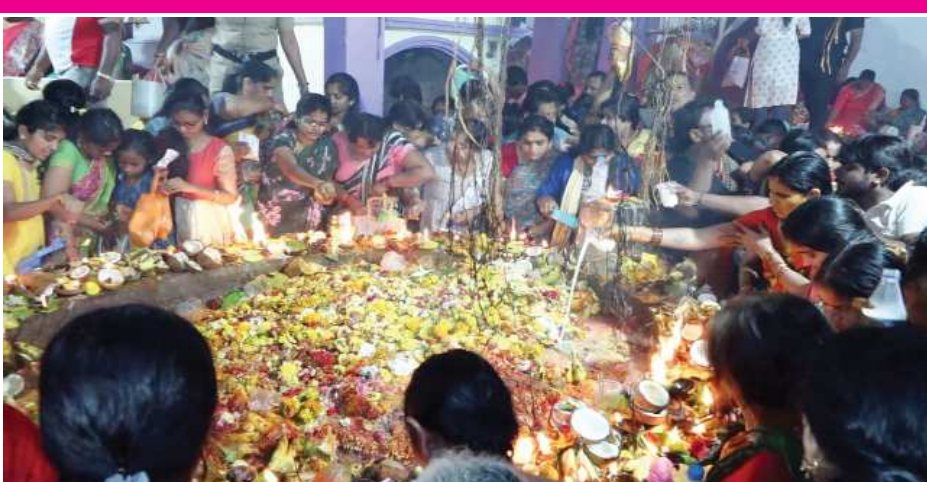
(షణ్ముఖ వెలుగు, ఒంగోలు, నవంబర్ 5)

కార్తీక మాసంలో పౌర్ణమికి ముందు వచ్చే తిథి చవితిని నాగుల చవితి పండుగగా జరుపుకుంటారు. నేడు నాగుల చవితి పర్వదినాన్ని పురస్కరించుకుని ఒంగోలు నగరంలో నాగేంద్ర స్వామి ఆలయానికి భక్తులు అధిక సంఖ్యలో తరలి వచ్చారు. తెల్లవారు ఝామున పుణ్య స్నానాలను ఆచరించి నాగేంద్ర స్వామి ఆలయానికి చేరుకుని అక్కడి నాగేంద్ర స్వామి వారికి మహిళలు అత్యంత భక్తిశ్రద్ధలతో ప్రత్యేక పూజలు నిర్వహించారు. రంగారాయుడు చెరువు, నెల్లూరు బస్టాండ్ వినాయకుని గుడి వద్ద ఉన్న నాగేంద్ర స్వామి పుట్ట, భాగ్యనగర్ ఫోర్ట్ లైన్ లోని ఉన్న నాగేంద్ర స్వామి పుట్ట వద్ద గల నాగేంద్ర స్వామి వారి పుట్ట కు మహిళలు విశేషంగా పోటెత్తారు. ముందుగా కార్తీక దీపాలు వెలిగించిన అనంతరం పుట్ట వద్ద నాగేంద్ర స్వామి వారికి ఆవు పాలను పోసి భక్తులను తమ భక్తిని చాటారు. నాగేంద్ర స్వామి అనుగ్రహం తమ పై ఎల్లవేళలా ఉండాలని స్వామివారిని ఆరాధించారు. ఆలయానికి వచ్చిన మహిళలకు ఎటువంటి ఇబ్బందులు తలెత్తకుండా ఆలయ కమిటీ సభ్యులు ప్రత్యేక ఏర్పాట్లు చేశారు.