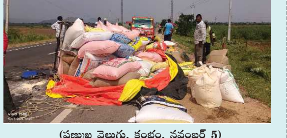
(షణ్ముఖ వెలుగు, కంభం, నవంబర్ 5)

జంగంపల్లె గ్రామ సమీపంలో అధిక బరువుతో మార్కెట్ నుంచి కంభం వస్తుండగా ఆటో బోల్తా పడింది. స్థానికుల వివరాల ప్రకారం మంగళవారం మార్కెట్ నుంచి అధిక బరువుతో సరుకులు వేసుకొని కంభం వస్తుండగా అదుపుతప్పి ఆటో బోల్తాపడింది. ఆటోలో ఉన్నవారికి ఎలాంటి హాని జరగలేదని, సరుకులు పూర్తిగా నేలమట్టమయ్యాయని లోడు ఎక్కువ ఉండడం వలన జిల్లా జరిగిందని తెలిపారు. సమాచారం అందుకున్న పోలీసులు సంఘటనా స్థలానికి వచ్చి విచారణ చేపట్టారు.