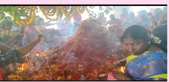
(షణ్ముఖ వెలుగు, ఉలవపాడు, నవంబర్ 5)

మండల కేంద్రమైన ఉలవపాడు దక్షిణ లైసెన్స్ పద్ద వేంచేయున్న స్వయంభు సుబ్రహ్మణ్యేశ్వర స్వామి ఆలయంలో నాగుల చవితీ సందర్భంగా మంగళవారం ఉదయం ఐదు గంటల నుంచి భక్తులు స్వామివారిని దర్శించుకొని భక్తిశ్రద్ధలతో స్వామివారికి పూజా కార్యక్రమాలు నిర్వహించారు. అనంతరం స్వామివారి తీర్థ ప్రసాదాలు స్వీకరించి స్వామివారిని అధిక సంఖ్యలో దర్శించుకున్నారు. స్వామివారి దర్శనానికి విచ్చేసిన భక్తులకు హైవేపై ఎటువంటి ప్రమాదాలు జరగకుండా హైవే పోలీసులు ముందు జాగ్రత్త చర్యగా భారీకేడర్స్ ఏర్పాటు చేశారు. నాగుల చవితీని మండలంలోని అన్ని గ్రామాలలోని శివాలయాలలో భక్తులు అధిక సంఖ్యలో పాల్గొని పూజా కార్యక్రమాలు నిర్వహించారు.