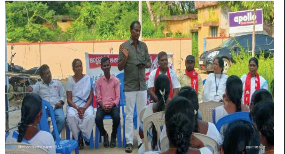
(షణ్ముఖ వెలుగు, పరదయ్యపాలెం, నవంబర్ 5)