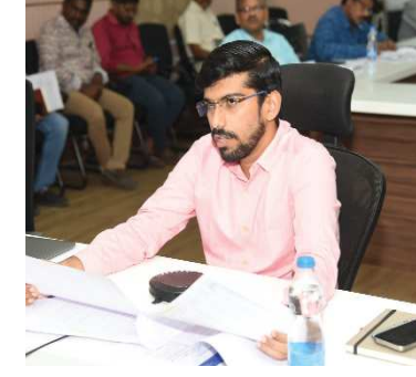
(షణ్ముఖ వెలుగు, నెల్లూరు, నవంబర్ 5) జిల్లాలోని ప్రభుత్వ, ప్రైవేటు పాఠశాలల్లోని విద్యార్థులందరికీ అపార్ ఐడీ కార్డుల మంజూరు ప్రక్రియను వెంటనే పూర్తిచేయాలని జిల్లా కలెక్టర్ ఓ. ఆనంద్

అధికారులను ఆదేశించిన జిల్లా కలెక్టర్ ఓ ఆనంద్