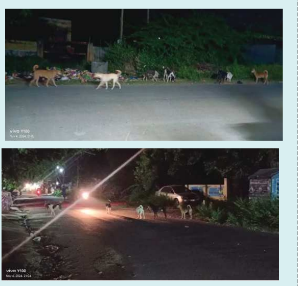
(షణ్ముఖ వెలుగు, కంభం, నవంబర్ 5)

కంభం సినిమా హాలు సెంటర్ నుంచి కందులాపురం రాత్రివేళ ప్రయాణించాలంటే భయపడిపోతున్న ప్రయాణికులు, పాదచారులు కుక్కల బెడదతో తీవ్ర ఇబ్బందులు ఎదుర్కొంటున్నారు. రాత్రి, పగలు తేడాలేకుండా వాహనదారులను వెంబడిస్తూ ప్రమాదాలకు గురిచేస్తున్న సందర్భాలు అధికంగా జరుగుతున్నా పట్టించుకోని అధికారులు. స్థానిక ప్రజలు సంబంధిత అధికారులకు విన్నవించుకొంటే ఈవీధి కుక్కలను వేరే వీధిలో వేరే వీధి కుక్కలను ఈ వీధిలో వదిలారని ఇదెక్కడి విద్వేషం అని, ఒక్క కిలోమీటరు పరిధిలోనే సుమారు 50 కుక్కలను దాటుకొని వెళ్లాలని వసులు చేసుకొని క్షేమంగా ఇళ్లకు వెళ్లలేక పోతున్నామని దయచేసి మాగోడు అలకించి కుక్కల బెడద నుండి మమ్మల్ని కాపాడాలని ఇప్పటికే చాలాసార్లు కరిచారుని, ఎన్నో ప్రమాదాలు కూడా జరిగాయని సంబంధిత అధికారులను స్థానిక ప్రజలు కోరుతున్నారు.