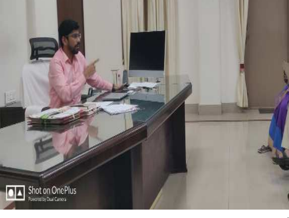
(షణ్ముఖ వెలుగు, నెల్లూరు, నవంబర్ 5) జిల్లాలో వ్యవసాయ సీజన్ ప్రారంభమైన దృష్ట్యా విత్తనాలు, ఎరువులు కొరత లేకుండా అన్ని ముందస్తు చర్యలు తీసుకోవాలని జిల్లా కలెక్టర్ ఓ. ఆనంద్ సంబంధిత అధికారులు ఆదేశించారు. మంగళవారం కలెక్టర్ ఓ. ఆనంద్ అనుబంధ రంగాలలో