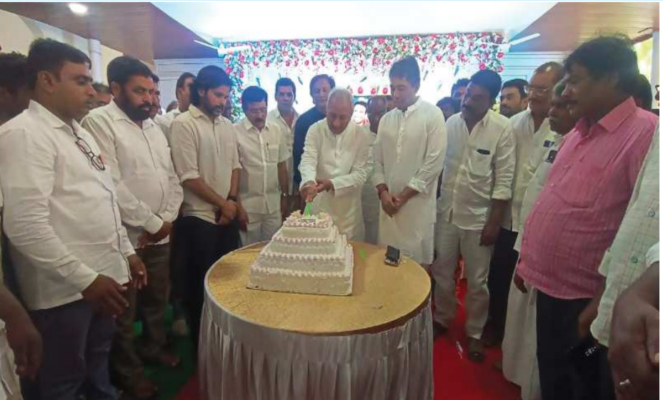
(షణ్ముఖ వెలుగు, మర్రిపాడు, నవంబర్ 2)