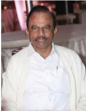
(షణ్ముఖ వెలుగు, ఒంగోలు, నవంబర్ 20)

ఒంగోలు పార్లమెంటు సభ్యులు మాగుంట శ్రీనివాసులురెడ్డి ఈ నెల 21వ తేదీన జరిగే పర్యటనా కార్యక్రమ వివరాలు ఆయన కార్యాలయ పర్గాలు వెల్లడించారు. ఉదయం 08గంటలకు ఒంగోలులో మాగుంట కార్యాలయంలో ప్రజలకు అందుబాటులో ఉంటారన్నారు. ఉదయం 11గంటలకు ఒంగోలులో