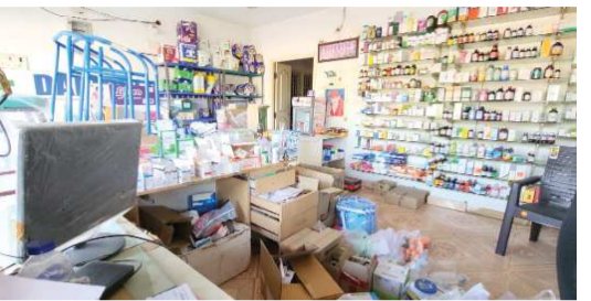
(షణ్ముఖ వెలుగు, ఒంగోలు, నవంబర్ 20)

ఒంగోలు పట్టణంలోని రాం నగర్ నాలుగో లైన్ లోని డాక్టర్ మెడికల్ షాపులో 2 గంటల సమయంలో దొంగలు పద్యారు. ఉదయం షాపు తెరవడానికి వచ్చిన యజమాని అప్పటికే షాపు తాళాలు తెరిచి ఉండటంతో షాక్ అయ్యారు. షాపులోకి వెళ్లి యజమాని