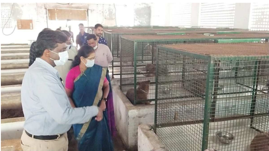
(షణ్ముఖ వెలుగు, ఒంగోలు, నవంబర్ 20)