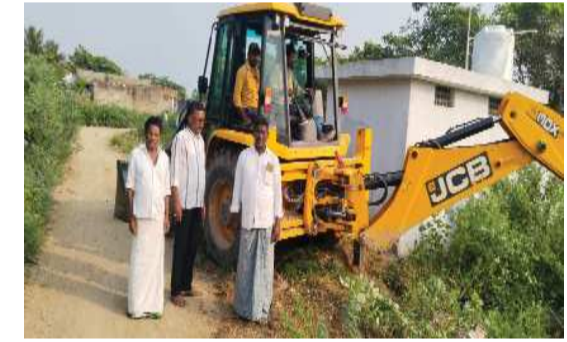
(షణ్ముఖ వెలుగు, ముత్రిపూడి, నవంబర్ 20)