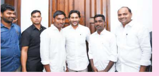
(షణ్ముఖ వెలుగు, పుల్లలచెరువు, నవంబర్ 20)