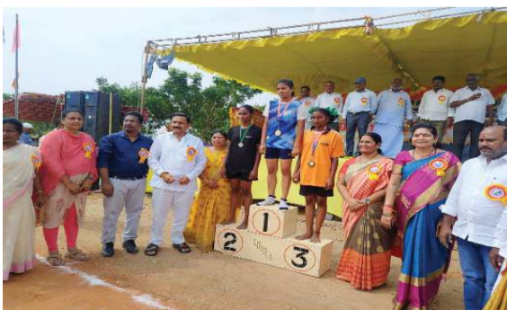
(షణ్ముఖ వెలుగు, సూర్యారావుపేట ఇంచార్జ్, నవంబర్ 20)