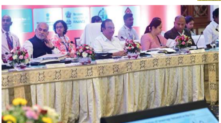
(షణ్ముఖ వెలుగు, ఒంగోలు, నవంబర్ 20)