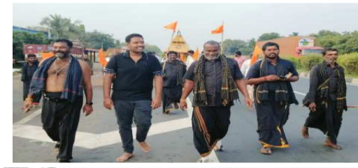
(షణ్ముఖ వెలుగు, అద్దంకి, నవంబర్ 19)