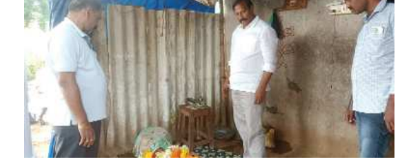
(షణ్ముఖ వెలుగు, కనిగిరి టౌన్, నవంబర్ 19)