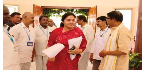
(షణ్ముఖ వెలుగు, నెల్లూరు, నవంబర్ 19)