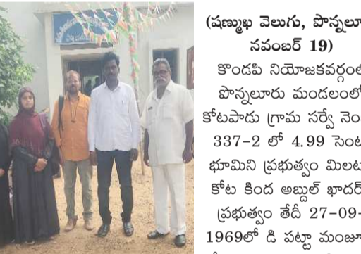
(షణ్ముఖ వెలుగు, పొన్నలూరు, నవంబర్ 19)