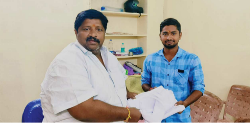
(షణ్ముఖ వెలుగు, పామరూ, నవంబర్ 19)