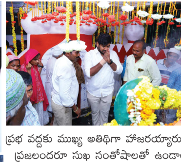
(షణ్ముఖ వెలుగు, పొదిలి, నవంబర్ 19)