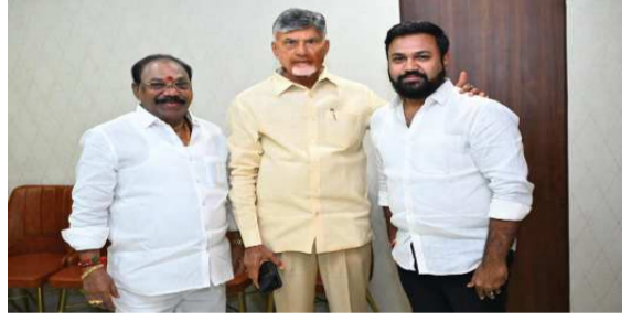
(షణ్ముఖ వెలుగు, నెల్లూరు, నవంబర్ 19)