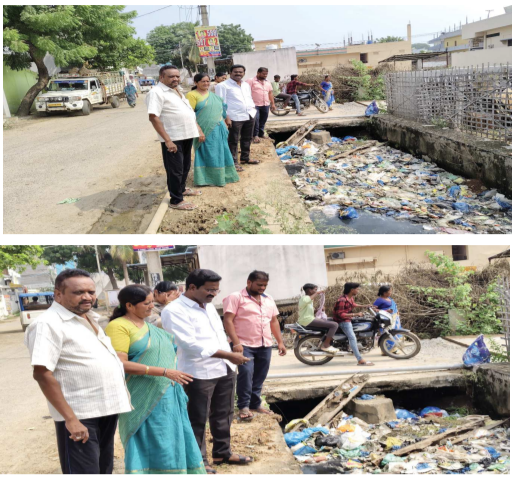
(షణ్ముఖ వెలుగు, పామరూ, నవంబర్ 19)