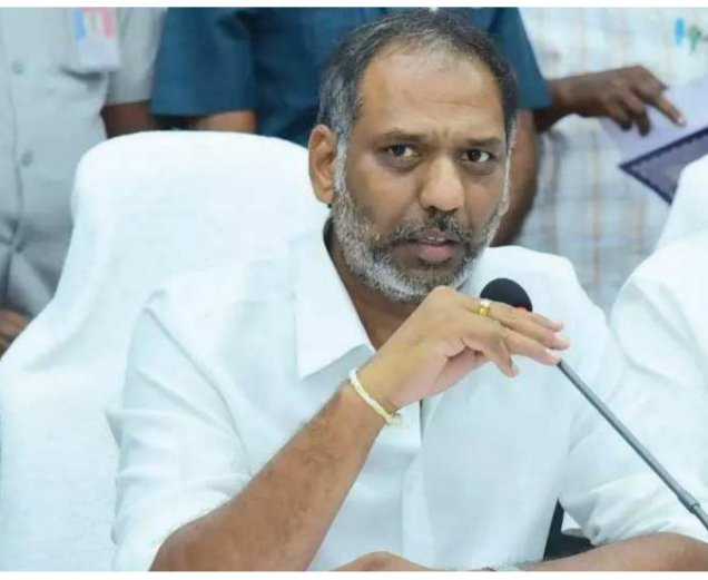
(షణ్ముఖ వెలుగు, అమరావతి, నవంబర్ 18) వ్యవసాయం మోటార్లకు స్మార్ట్ మీటర్లు బిగించే ప్రసక్తే లేదని మంత్రి గొట్టిపాటి రవి కుమార్ స్పష్టం చేశారు. మండలి ప్రశ్నోత్తరాల సమయంలో దీనిపై మంత్రి గొట్టిపాటి రవి కుమార్ మాట్లాడారు. గత ప్రభుత్వం అనాలోచిత నిర్ణయాల కారణంగా విద్యుత్ రంగ సంస్థలపై సుమారు రూ. 1.29 లక్షల కోట్ల భారం పడిందని మంత్రి గొట్టిపాటి రవి కుమార్ తెలిపారు. జగన్ మోహన్ రెడ్డి

అధికారంలోకి వచ్చిన తరువాత పీపీఏ ల రద్దు అంశం చాలా వివాదాస్పదం అయినట్లు మంత్రి పేర్కొన్నారు. కేవలం పీపీఏ ల రద్దు కారణంగా పెట్టుబడులు పెట్టేందుకు ముందుకు వచ్చిన పారిశ్రామికవేత్తలు ఇతర రాష్ట్రాలకు తరలిపోయినట్లు పేర్కొన్నారు. నాడు జగన్ మోహన్ రెడ్డి తీసుకున్న నిర్ణయం సరైనది కాదని కేంద్ర ప్రభుత్వం స్పష్టంగా లేఖ రాసిన విషయాన్ని మంత్రి గొట్టిపాటి గుర్తు చేశారు. ప్రతి ఏడాది వినియోగదారుల సంఖ్య 5 నుంచి 6 శాతం పెరుగుతున్నా కానీ జగన్ ప్రభుత్వం అధికారంలో ఉన్న ఐదేళ్ల కాలంలో కొత్తగా ఒక్క మోగా వాట్ విద్యుత్ ను కూడా ఉత్పత్తి చేసిన పాపన పోలేదని విమర్శించారు. విద్యుత్ వ్యవస్థను గాడిన పెట్టేలా కూటమి ప్రభుత్వం చర్యలు తీసుకుంటుందన్నారు. కూటమి ప్రభుత్వం గ్రీన్ అండ్ రెన్యూవబుల్ ఎనర్జీకి అధిక ప్రాధాన్యం ఇస్తున్నట్లు మంత్రి గొట్టిపాటి రవి కుమార్ తెలిపారు. ఇందు కోసం ఏకంగా రాష్ట్ర ప్రభుత్వం పాలనీ తీసుకొచ్చిన విషయాన్ని మంత్రి గుర్తు చేశారు. ఏపీ తీసుకొచ్చిన పాలనీ కారణంగా రాష్ట్రానికి పెట్టుబడులు క్రమంగా వస్తున్నాయని అన్నారు. గత ప్రభుత్వం తీసుకుని వచ్చిన చట్టం లోని లోపాలను సరిదిద్దే ప్రయత్నంలో భాగంగా ఆంధ్రప్రదేశ్ విద్యుత్ సుంకం (రిండ్ సవరణ), 2024 బిల్లు తీసుకువస్తున్నట్లు మంత్రి గొట్టిపాటి రవి కుమార్ తెలిపారు. ఈ సవరణ వల్ల వినియోగదారులపై కొత్తగా (తరువాతి 4లో...)