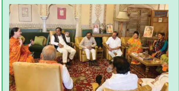
(షణ్ముఖ వెలుగు, ఒంగోలు, నవంబర్ 18)

గృహ, పట్టణ వ్యవహారాల కమిటీ పర్యటనలో భాగంగా రాజస్థాన్ రాష్ట్రంలోని జైపూర్లో ఉప ముఖ్యమంత్రి దియా కుమారి ఏర్పాటు చేసిన తేనెనీ విందులో ఎంపీ మాగుంట పాల్గొన్నారు. అనంతరం గృహ, పట్టణ వ్యవహారాల కమిటీ పర్యటనలో భాగంగా సోమవారం రాజస్థాన్ రాష్ట్రంలోని జైపూర్లోని మెట్రో కమిటీ చైర్మన్ , ఒంగోలు పార్లమెంటు సభ్యులు మాగుంట శ్రీనివాసులు రెడ్డి, ఇతర కమిటీ సభ్యులు సందర్శించారు.