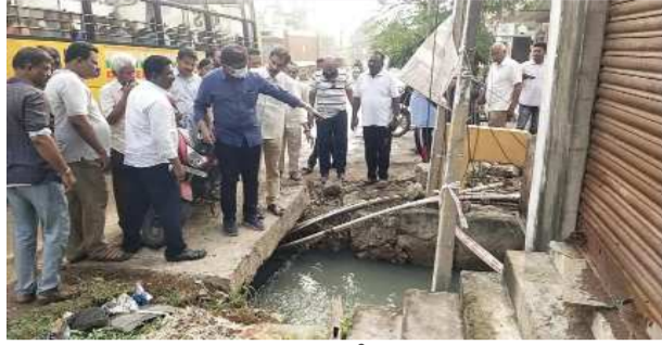
(షణ్ముఖ వెలుగు, ఒంగోలు, నవంబర్ 18)