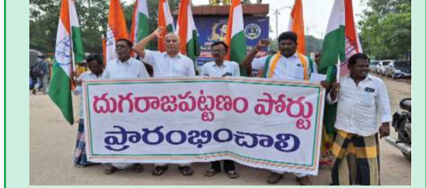
(షణ్ముఖ వెలుగు, సూర్యపేట ఇంచార్జ్, నవంబర్ 18)