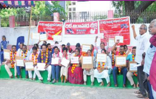
(షణ్ముఖ వెలుగు, ఒంగోలు, నవంబర్ 18)