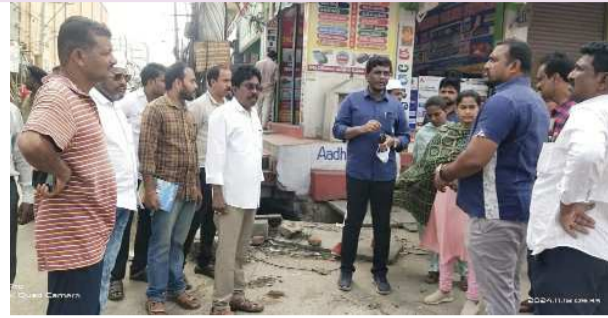
(షణ్ముఖ వెలుగు, ఒంగోలు, నవంబర్ 18)

మొత్తం కూడా ప్రతిరోజు పీల్డ్లో ఉండి ఈ కార్యక్రమంలో తప్పనిసరిగా పాల్గొనాలని ఆదేశాలు ఇచ్చారు. భాస్కరగర్లో 11వ అడ్డరోడ్డులో పర్యటించి అక్కడ ఉన్న కాలువలో పూడికను వెంటనే తీసివేయాలి అని శానిటరీ ఇన్స్పెక్టర్ కి ఆదేశాలు ఇచ్చారు. అలానే రోడ్డుకు ఇరువైపులా పెరిగిన పచ్చిమొక్కలను తీసివేయాలని ఆదేశాలు ఇచ్చారు. తప్పనిసరిగా దుంఠాల సాయంతో ఆయా పనులను నిర్వహించే సమయంలో పూర్తి చేయాలని ఆదేశాలు ఇచ్చారు. ప్రతి రోజు కూడా అందరు ఆఫీసర్ కూడా పని ప్రారంభించే ముందర ఫోటో అలానే ఆ రోజు చివర పని పూర్తి చేసిన ఫోటోని తప్పనిసరిగా తమ ఛాంబర్ నందు ఇవ్వాల్సి అని ఆదేశాలు ఇచ్చారు. అనంతరం 4 వ డివిజన్లో ఇన్సైం పేట