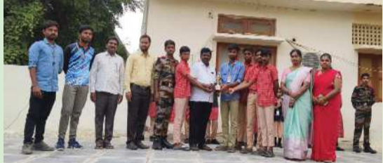
(షణ్ముఖ వెలుగు, మార్కాపురం ఇన్ఫార్మి, నవంబర్ 18)