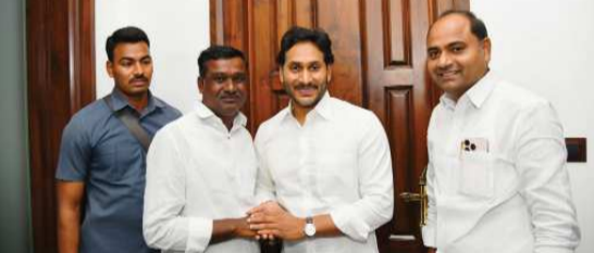
(షణ్ముఖ వెలుగు, పుల్లెచెరుపు, నవంబర్ 18)