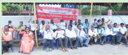
(షణ్ముఖ వెలుగు, ఒంగోలు, నవంబర్ 18)