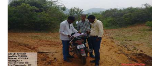
(షణ్ముఖ వెలుగు, హనుమంతునిపాడు, నవంబర్ 18)

మండల కేంద్రంలోని పలు గ్రామాలలో కంప్లెక్స్ బయో గ్యాస్ పరిశ్రమల స్థాపన కోసం హనుమంతునిపాడు మండలం ముప్పాళ్ల పాడు, దానలపల్లి, విరగారెడ్డి పల్లి గ్రామాలలో గల ప్రభుత్వ భూములను రిలయన్స్ కంపెనీ ప్రతినిధులు సోమవారం పరిశీలించారు. ముప్పాళ్లపాడు గ్రామంలో 280.56 ఎకరాలు దానలపల్లి గ్రామంలో 196.56 సెంట్ల విరగారెడ్డి పల్లి గ్రామంలో 116.76 సెంట్ల భూములను తనిఖీ చేశారు.