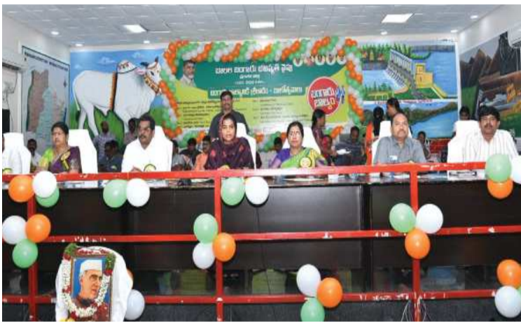
(షణ్ముఖ వెలుగు, ఒంగోలు, నవంబర్ 14)