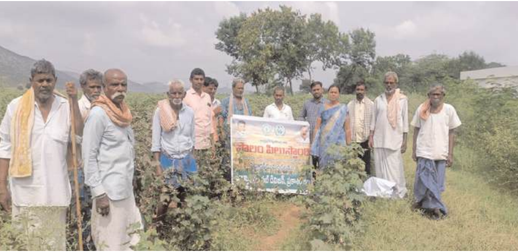
కార్బన్ డైఆక్సైడ్ వంటి అంతర్జాతీయ శిబింద్ర నాశని గాని విత్తన శుద్ధి చేసుకోవాలని తెలిపారు.

(షణ్ముఖ వెలుగు, పెద్దారవీడు, నవంబర్ 13) మండల వ్యవసాయ అధికారి ఆధ్వర్యంలో వృచ్ఛికాయలపల్లె రైతు సేవ కేంద్రం పరిధిలోని రైతుల పొలాలలో ప్రత్తి పంటలో పొలం పిలుస్తుంది కార్యక్రమం నిర్వహించడం జరిగింది. ఈ కార్యక్రమంలో భాగంగా మండల వ్యవసాయ అధికారి తో పాటుగా వెటర్నరీ సిబ్బంది, కూడా పాల్గొన్నారు. ఈ కార్యక్రమంలో మండల వ్యవసాయ అధికారి మాట్లాడుతూ ప్రత్తి పంటలో ప్రస్తుతం తీసుకోవాల్సిన జాగ్రత్తలు వాతావరణ సూచనలకు తగినట్లుగా తెగల నివారణ చర్యలు ఎలా చేపట్టాలో తెలియజేశారు.. మండల వ్యవసాయ అధికారి మాట్లాడుతూ ప్రస్తుతం సీజన్లో తెగులు రావడం జరుగుతుంది అని వాటిలో ఎక్కువగా వేరు కుళ్ళు తెగులు వడలు తెగులు ఆల్టర్నేట్ అకుమచ్చ తెగులు , పక్కి కన్ను తెగులు వంటివి ఎక్కువగా సోకతాయని వాటికి తీసుకోవాల్సిన జాగ్రత్తలు మరియు గుర్తింపు లక్షణాలు రైతులకు తెలియజేశారు. వేరు కుళ్ళు తెగులు ఈ తెగులు భూమిలో తేమ అధికంగా ఉన్నప్పుడు మొక్కలకు ఏ దశలోనైనా ఈ తెగులు సోకుతుందని తెలియజేశారు ఈ తెగులు సోకిన మొక్కలు భూమి నుండి పీకినా కూడా తేలికగా వస్తాయని ఈ తెగులు సోకినప్పుడు ఎదిగిన మొక్కలు కూడా వడలిపోయి పొలంలో గుంపులు గుంపులుగా ఎండిపోతాయని ఆకులు రాలిపోతాయని పేర్లపై ఉండే బెరడు వగిలిపోతుందని కొన్నిసార్లు నల్లటి మక్కలంటి శిబింద్ర బీజాలు కూడా కనబడతాయని తెలియజేశారు. ఈ తెగులు సోకినప్పుడు భూమిలోని చేయూత ఉష్ణోగ్రతను బట్టి 30% నుంచి 90 శాతం వరకు పంట నష్టం వాటిల్లి అవకాశముంటుంది తెలియజేశారు దీని నివారణకు 10 గ్రా ట్రైకోడెర్మా వంటి సిబింద్ర నాశనిగానే లేదా 2 గ్రా..