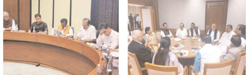
గృహ, పట్టణ వ్యవహారాల మంత్రిత్వ శాఖ ప్రతినిధులతో సంగ్రహ సమాచారం, సూచనలపై మాగుంట శ్రీనివాసులరెడ్డి, కమిటీ సభ్యులు చర్చలు జరిపారు.

(షణ్ముఖ వెలుగు, ఢిల్లీ, నవంబర్ 13) ఢిల్లీలో పార్లమెంటు భవనంలోని కమిటీ హాలులో గృహ ,పట్టణ వ్యవహారాల పార్లమెంటరీ కమిటీ చైర్మన్, ఒంగోలు పార్లమెంటు సభ్యులు, మాగుంట శ్రీనివాసులరెడ్డి కమిటీ సభ్యులతో బుధవారం సమావేశాన్ని నిర్వహించారు. ఈ సమావేశంలో రీజినల్ రాబిడ్ ట్రాన్సిట్ సిస్టం, నేషనల్ కాపిటల్ రీజియన్ ట్రాన్స్ పోర్ట్ కార్పొరేషన్ పాత్రపై కేంద్ర గృహ, పట్టణ వ్యవహారాల మంత్రిత్వ శాఖ ప్రతినిధులతో సంగ్రహ సమాచారం, సూచనలపై మాగుంట శ్రీనివాసులరెడ్డి, కమిటీ సభ్యులు చర్చలు జరిపారు.