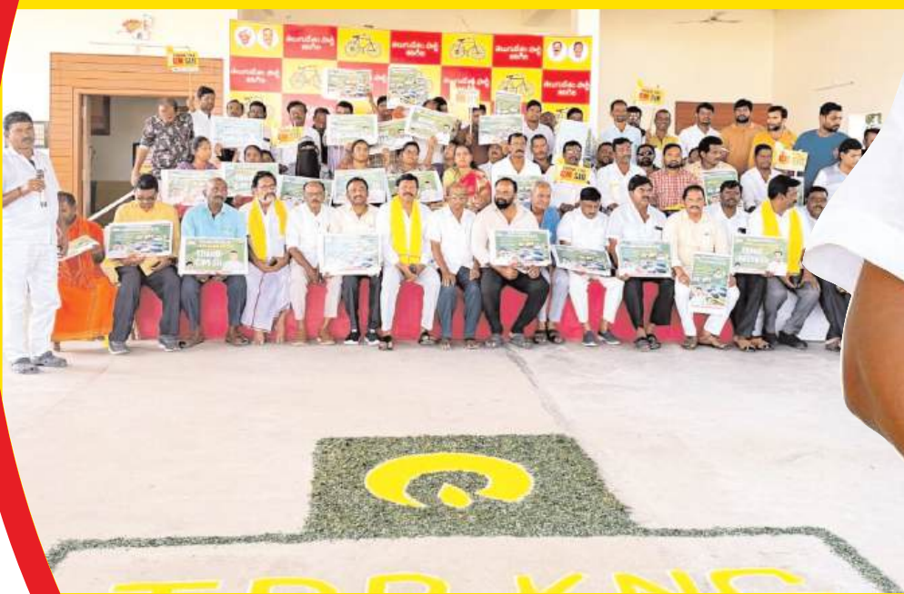
(షణ్ముఖ వెలుగు, కనిగిరి, నవంబర్ 13)

కనిగిరి కి బయో గ్యాస్ ఫ్లాంట్ కు డిశంబర్ లో భూమి పూజ అభివృద్ధి వైపే ఉగ్ర అడుగులు "బుర్రా" పాలనలో అభివృద్ధి "ఇండి సున్నా" ఉగ్రకు ప్రశంసల వెల్లువ