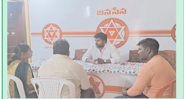
(షణ్ముఖ వెలుగు, నెల్లూరు, అక్టోబర్ 19)