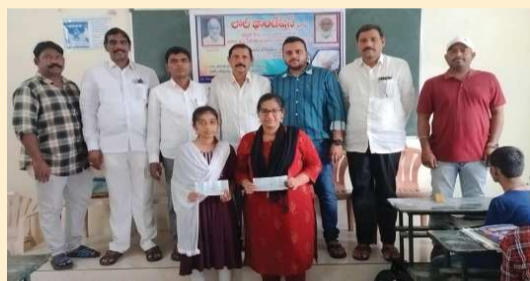
(షణ్ముఖ వెలుగు, పొదిలి, అక్టోబర్ 19)