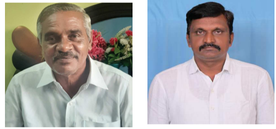
(షణ్ముఖ వెలుగు, ఒంగోలు, అక్టోబర్ 19)

ఉమ్మడి ప్రకాశం జిల్లా యాదవ జేపీసీ వ్యవస్థాపక అధ్యక్షులు మిరియం, జిల్లా అధ్యక్షులు చిరుమామిళ్ల