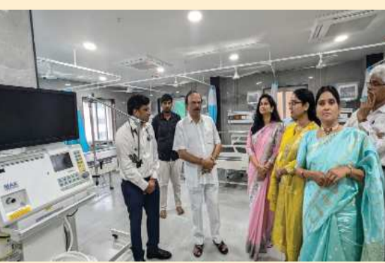
(షణ్ముఖ వెలుగు, ఒంగోలు, అక్టోబర్ 19)