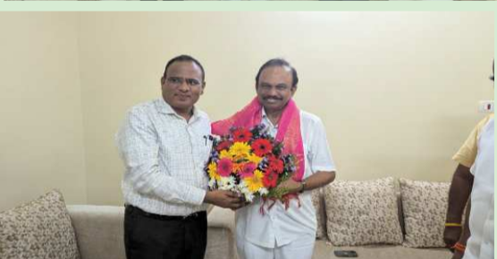
(షణ్ముఖ వెలుగు, ఒంగోలు, అక్టోబర్ 19)