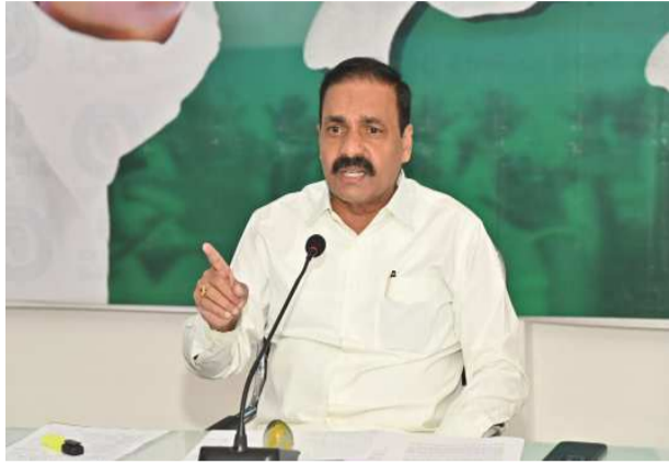
రద్దు అని ప్రకటించారని దుయ్యబట్టారు. గతంలో ఎన్నడూ లేని విధంగా ఇసుక ధర వేలల్లో ఉండగా, సీనరేజ్ రద్దుతో కేవలం పదుల్లోనే