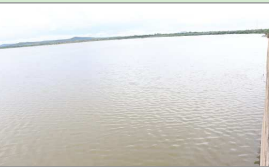
(షణ్ముఖ వెలుగు, ఉలవపాడు, అక్టోబర్ 19)

లింగసముద్రం మండలంలో గల రాళ్లపాడు ప్రాజెక్టును శనివారం ఎమ్మెల్యే ఇంటూరి నాగేశ్వరరావు సందర్శించారు. ఈ సందర్భంగా ప్రాజెక్టు పూర్తి సామర్థ్యం 20 అడుగులు కాగా ప్రస్తుతం ప్రాజెక్ట్ నీటిమట్టం సుమారు 15 అడుగుల నీరు చేరిందని అధికారులు ఎమ్మెల్యేకి తెలియజేశారు. ఎమ్మెల్యే అధికారులతో మాట్లాడుతూ సోమశిల ప్రాజెక్టునుంచి ఉత్తర కాలువ ద్వారా ఎంత మేర నీరు ప్రాజెక్టులోకి చేరుతుందని అడిగి తెలుసుకున్నారు. భారీ వర్షాల నేపథ్యంలో రాళ్లపాడు ప్రాజెక్టు పూర్తి సామర్థ్యం మేరకు నీరు చేరిన తర్వాత గట్టు తెరిచి నీరు క్రింది వైపుకు విడుదల చేయ సందర్భంలో మన్నేరు పరివాహక ప్రాంత గ్రామ ప్రజలను అప్రమత్తం చేయాలని అధికారులకు ఆదేశించారు. ఈ కార్యక్రమంలో రాళ్లపాడు ప్రాజెక్టు అధికారులు, తెలుగుదేశం పార్టీ నాయకులు పాల్గొన్నారు.