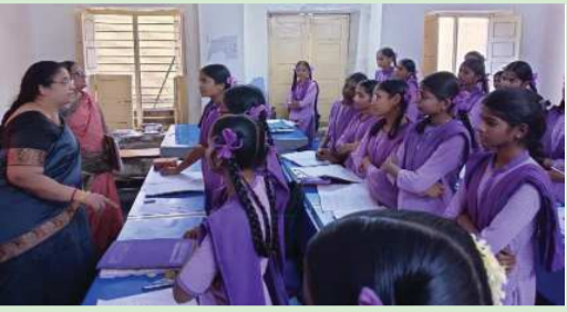
(షణ్ముఖ వెలుగు, గిద్దలూరు, అక్టోబర్ 19)