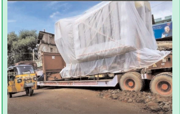
(షణ్ముఖ వెలుగు, నాయుడుపేట, అక్టోబర్ 19)

నాయుడుపేట పట్టణం పాత బ్రిజ్ వీధిలోని ప్రధాన రహదారిపై నిత్యం ట్రాక్టర్ ప్రజలు ఇబ్బందులు పడుతున్నారు. గుంతల మయంగా మారిన ఈ రహదారిపై పలు ప్రమాదాలు సైతం చోటు చేసుకుంటున్నాయని స్థానికులు ఆవేదన వ్యక్తం చేశారు. అధికారులు స్పందించాలని వారు కోరారు.