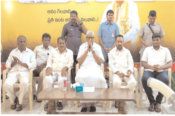
(షణ్ముఖ వెలుగు, నెల్లూరు, అక్టోబర్ 19)