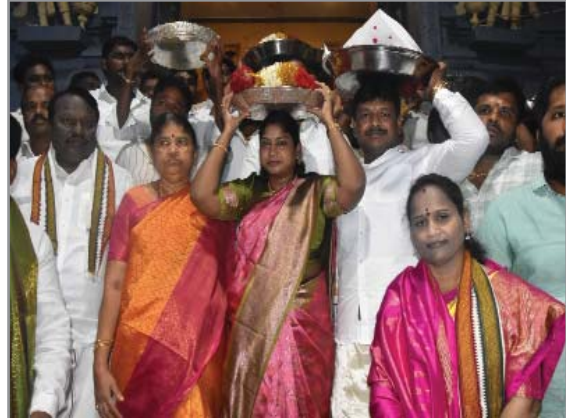
(షణ్ముఖ వెలుగు, సూళ్లూరుపేట ఇంచార్జ్, అక్టోబర్ 13)

సారె సమర్పించిన సూళ్లూరుపేట ఎమ్మెల్యే దంపతులు