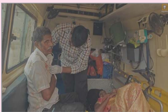
(షణ్ముఖ వెలుగు, నాయుడుపేట, అక్టోబర్ 13)

నాయుడుపేట మండలం నరసారెడ్డి కండ్లగి గ్రామ సమీపంలో ఆదివారం జరిగిన రోడ్డు ప్రమాదంలో ఆరుగురికి తీవ్ర గాయాలయ్యాయి. సూళ్లూరుపేటలో జరిగిన వివాహానికి హాజరై తిరిగి అన్నమేడు గ్రామానికి ఆటోలో వెళ్తుండగా కారు ఆటోను ఢీకొంది. ఆటోలో ఉన్న అన్నమేడు గ్రామానికి చెందిన ఆరుగురు గాయపడగా స్థానిక ప్రభుత్వ ఆసుపత్రికి తరలించి చికిత్స అందిస్తున్నారు. పోలీసులు కేసు నమోదు చేసి దర్యాప్తు చేస్తున్నారు.