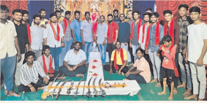
షణ్ముఖ వెలుగు కోరుట్ల టోన్ ప్రతినిధి అక్టోబరు 06: జగిత్యాల జిల్లా కోరుట్ల పట్టణంలోని వి.ఎల్. పైనాన్స్ సమీపంలో విశ్వభూహూణ