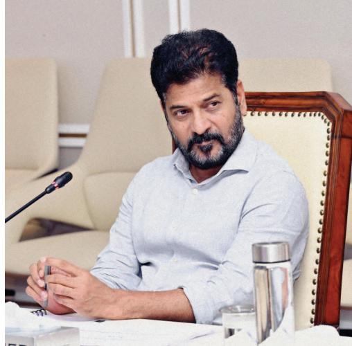
ప్రచారాన్ని తిప్పికొట్టడంలో విఫలమవుతున్న విషయాన్ని కూడా చర్చించారు. చెరువులు, పార్కుల పరిరక్షణ కోసం ఏర్పాటు చేసిన వ్యవస్థ విషయంలో ప్రజల్లో పాజిటివ్ చర్చ

జవాబు ఇస్తామంటోంది. విపక్షాల విమర్శలను ఎలా తిప్పికొట్టాలనే దానిపై మేధోమధనం చేస్తోంది. అందుకే సరికొత్త వ్యూహంతో ముందుకెళ్లాలని చూస్తోంది కాంగ్రెస్. విపక్షాల వ్యూహాలను చిత్తు చేసేందుకు సరికొత్త ఆస్ట్రాన్య సిద్ధం చేసుకుంటోంది.కార్పొరేషన్ వైరెస్స సమావేశంలో సీఎం రేవంత్, పీసీసీ చీఫ్ మహేశ్ కుమార్ గౌడ్ ప్రధానంగా ఒక అంశాన్ని బలంగా ప్రస్తావించినట్లు తెలుస్తోంది. పదేళ్ల తర్వాత కార్యక్రమం బలంగా పోరాడి సాధించిన అధికారాన్ని కలిసి కట్టుగా నిలబెట్టుకోవాల్సిన అవసరం ఉందని సెంటిమెంట్ ను రగిలించారు. ప్రభుత్వం అనేక మంచి పనులు చేస్తున్నా..వాటిని జనంలోకి సమర్థవంతంగా తీసుకెళ్లడంలో విఫలమవుతున్నామనే అంశాన్ని ప్రస్తావించినట్లు తెలిసింది. పెద్ద మొత్తంలో రుణమాఫీ చేసినా అనుకున్నంత పాజిటివ్ రాకపోగా..జనంలో నెగిటివ్ అవుతున్నామని ప్రస్తావించారు. రుణమాఫీ కాని రైతులకు కూడా త్వరలో రుణమాఫీ చేస్తామనే భరోసా క్యాడర్ కు కల్పించాలని నేతలకు దిశానిర్దేశం చేశారు. ఇక హైద్రా విషయంలో విపక్షాలు చేస్తున్న