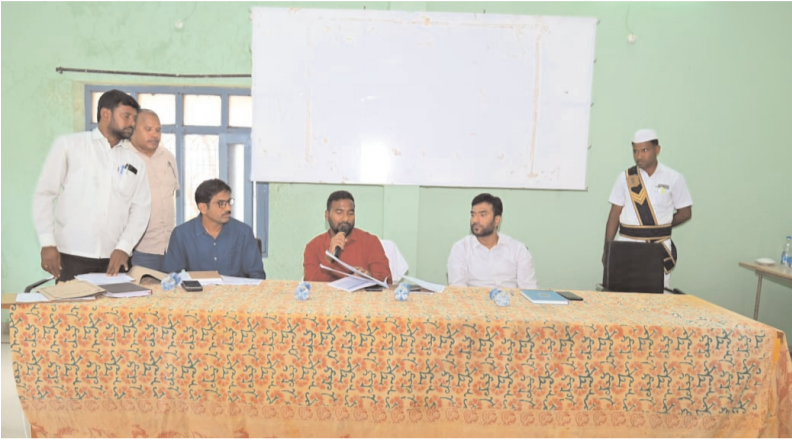
జిల్లా కలెక్టర్ బి.సత్య ప్రసాద్

షణ్ముఖ వెలుగు మల్లాపూర్ ప్రతినిధి అక్టోబరు 30: జిల్లాలో నిర్వహించనున్న సమగ్ర కుటుంబ సర్వేను అధికారులు పకడ్బందీగా పూర్తి చేయాలని జిల్లా కలెక్టర్ బి. సత్య ప్రసాద్ సూచించారు. స్థానిక మండల కేంద్రంలోని ప్రజా పరిషత్తు కార్యాలయంలో రాష్ట్ర ప్రభుత్వం ప్రతిష్ఠాత్మకంగా చేపట్టనున్న సమగ్ర కుటుంబ సర్వేపై ఆంగన్వాడీ ఆశ వర్కర్ల పంచాయతీ సెక్రటరీ లకు శిక్షణా కార్యక్రమాన్ని నిర్వహించారు. అనంతరం జిల్లా కలెక్టర్ మాట్లాడుతూ ప్రతి ఇంటికి వెళ్లి కుటుంబ యజమానితో పాటు ఇంట్లో వారి వివరాలు పక్కాగా నమోదు చేయాలని గ్రామాల్లో అధికారులు ఇచ్చిన మ్యాప్ ఆధారితంగా నాలుగు జోన్ లుగా విభజించి అధికారులు