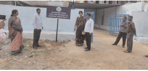
మున్సిపాలిటీ స్థలంలో కల్లు కాంపౌండ్ ఏర్పాటు పై వార్త రాస్తే విలేఖరి కి బెదిరింపులు

మేడ్చల్ డిసిపి ని కలిసిన జర్నలిస్టు సంఘం విలేకరి ఫిర్యాదు మేరకు కల్లు కాంపౌండ్ నిర్వాహకులపై కేసు నమోదు