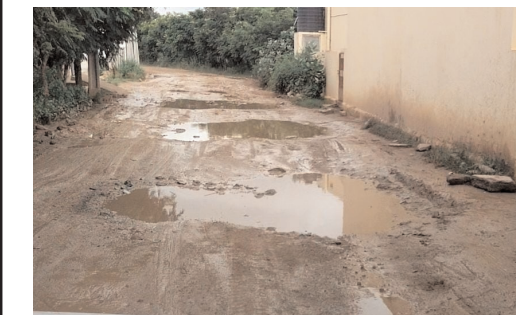
- అయ్యు మేయర్,కమిషనర్ మా రోడ్డు పరిస్థితి చూడండి.

- మీ ఇంటి ముందు రోడ్డు ఇలానే ఉన్నాయా అంటూ కాలనీ వాసులు ఆందోళన