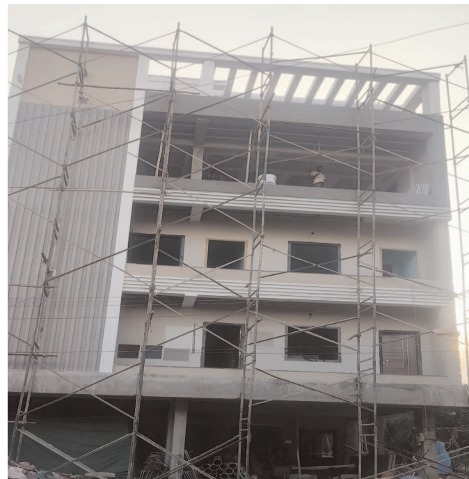
కూల్చివేసిన నిర్మాణ దారుల పై కఠిన చర్యలు తీసుకోవాలని స్థానిక ప్రజలు కోరుతున్నారు.

అనుమతులు రెండు అంతస్తులకు నిర్మాణాలు మాత్రం నాలుగు, ఐదు అంతస్తులు మొదటి నిద్రలో మున్సిపల్ అధికారులు రోజూ రోజూకి శ్రమిమించుతున్న అక్రమ నిర్మాణాలు షాన్ముఖ వెలుగు మేడిపల్లి ఫుట్ కేసర్ ప్రతినిధి అక్టోబరు 01 మేడ్చల్ జిల్లా ఫుట్ కేసర్ మండలంలోని పోచారం మున్సిపాలిటీ పరిధి అక్రమ నిర్మాణాలకు అడ్డాగా మారింది. అనుమతులు రెండు అంతస్తులకు ఉంటే అక్రమంగా అనుమతి లేకుండా నాలుగు ఐదు అంతస్తులు నిర్మిస్తున్నారు. అడిగే వారు లేక అక్రమ నిర్మాణాలు పుట్టగొడుగుల్లా గా వెలుస్తున్నాయి. అక్రమ నిర్మాణాలను పట్టించుకోవాల్సిన అధికారులు లక్షల్లో జేబులు నింపుకొని అటువైపు కన్నెత్తి కూడా చూడకపోవడం వల్ల అక్రమార్కుల ఆగడాలు మితి మీరి పోతున్నాయి. అక్రమ నిర్మాణాలు జరగకుండా చూడాలని అధికారులు కానుకలకు కక్కుర్తి పడి అక్రమ నిర్మాణాలకు ఆజ్యం పోస్తున్నారు. పోచారం మున్సిపల్ పరిధిలోని యెన్నం పేట్ లో అనుమతులకు విరుద్ధంగా భారీ అక్రమ నిర్మాణం యదేచ్ఛగా జరుగుతున్నప్పటికీ తమకేమీ పట్టనట్టుగా అధికారుల మౌనం పై సర్వత్ర విమర్శలు వెల్లువెత్తుతున్నాయి. ఈ అక్రమ నిర్మాణానికి పోచారం మున్సిపల్ టౌన్ ప్లానింగ్ అధికారులు లక్షల్లో ముడుపులు అందుకున్నట్లు ప్రజలు గుసగుస లాడుకుంటున్నారు. అధికారులు సామాన్య ఇండ్ల నిర్మాణాలను కూల్చివేస్తున్నారని కానీ డబ్బు అధికార బలం ఉన్న నిర్మాణ దారుల వైపు కన్నెత్తి కూడా చూడకపోవడంతో స్థానిక మున్సిపాలిటీ లోని ప్రజల నుంచి తీవ్ర విమర్శలు వెల్లువెత్తుతున్నాయి. అక్రమ నిర్మాణాలు యదేచ్ఛగా జరుగుతుంటే అధికారులు ఎందుకు చర్యలు తీసుకోవడం లేదని ప్రశ్నిస్తున్నారు. ఇప్పటికైనా మున్సిపల్ అధికారులు, జిల్లా కలెక్టర్ చర్య తీసుకుని అక్రమ నిర్మాణాలను