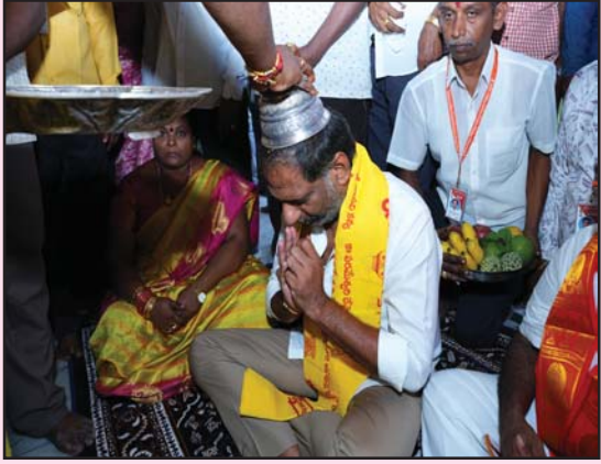
(షణ్ముఖ వెలుగు, అక్టోబర్ 7)

దసరా శరన్నవరాత్రి ఉత్సవాలలో భాగంగా పట్టణంలోని శ్రీ చక్ర సహిత శ్రీవాసవి కన్యకా పరమేశ్వరి అమ్మవారి దేవస్థానం కమిటీ ఆహ్వానం మేరకు సోమవారం రాష్ట్ర విద్యుత్ శాఖ మంత్రి గొట్టిపాటి రవికుమార్ హాజరయ్యారు. ఈ సందర్భంగా ఆలయ పూజారులు ఆయనను మేళనాళాలు, వేద పండితుల మంత్రోచ్ఛారణలతో ఆలయ కమిటీ సభ్యులు ఘన స్వాగతం పలికారు. ఈ సందర్భంగా శ్రీ వాసవి కన్యకాపరమేశ్వరి అమ్మవారిని దర్శించుకుని ప్రత్యేక పూజలు నిర్వహించిన మంత్రి గొట్టిపాటి రవికుమార్ అనంతరం మాట్లాడుతూ శ్రీ దేవీ శరన్నవరాత్రి ఉత్సవాల్లో భాగంగా హిమవర్షిని దేవిగా దర్శనమిస్తున్న శ్రీ వాసవి కన్యకా పరమేశ్వరి అమ్మవారు చెడును నాశనం చేసి గ్రహ పీడలు తొలగించే ఆ హిమవర్షినిదేవి అనుగ్రహం, ఆశీస్సులు ప్రజలందరి పై ఉండాలని, రాష్ట్రంలో పాడిపంటలు సంపృద్ధిగా పండాలని కోరుకున్నట్లు మంత్రి తెలిపారు. అలయ కమిటీ ఆధ్వర్యంలో శాలువాతో సన్మానించి జ్ఞాపికను అందజేశారు. ఈ కార్యక్రమంలో అలయ కమిటీ అధ్యక్షులు, సభ్యులు, స్థానిక తెదేపా నేతలు, తదితరులు పాల్గొన్నారు.