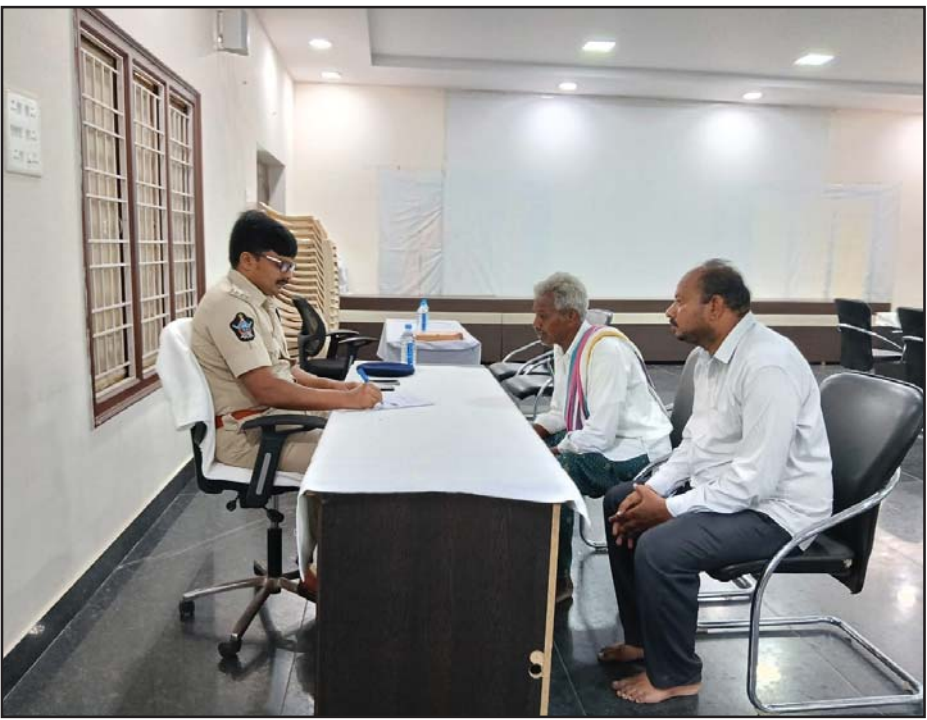
(షణ్ముఖ వెలుగు, ఒంగోలు, అక్టోబర్ 7)

ఎవస్పీ కె నాగేశ్వరరావు ప్రజా సమస్యల పరిష్కార వేదిక కార్యక్రమానికి 54 ఫిర్యాదులు