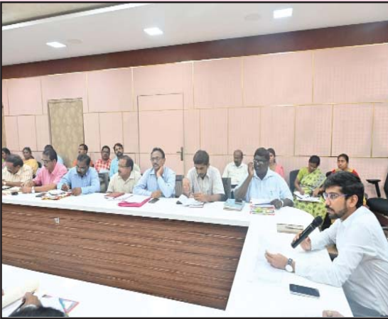
(షణ్ముఖ వెలుగు, నెల్లూరు, అక్టోబర్ 7)