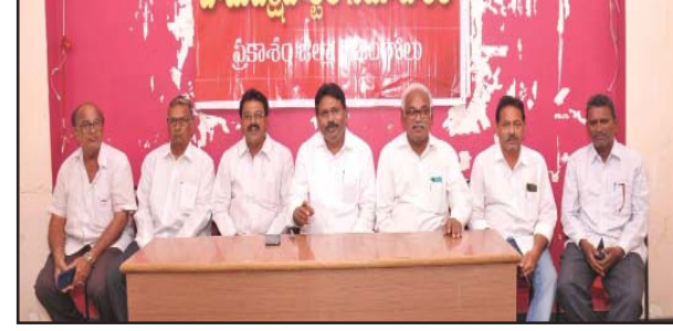
(షణ్ముఖ వెలుగు, ఒంగోలు, అక్టోబర్ 4)

7న జిల్లావ్యాప్తంగా నిరసన కార్యక్రమాలు జయప్రదం చేయండి వామపక్ష పార్టీల పిలుపు