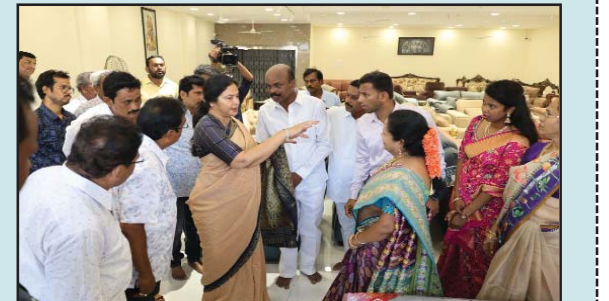
(షణ్ముఖ వెలుగు, నెల్లూరు, అక్టోబర్ 4)