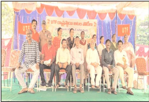
(షణ్ముఖ వెలుగు, ఒంగోలు, అక్టోబర్ 4)

యుటిఎఫ్ రాష్ట్రస్థాయి అటల పోటీలలో అడ్లెటిక్స్ మహిళా విభాగంలో ప్రకాశం జిల్లా జట్లు దూసుకుపోతున్నాయి.