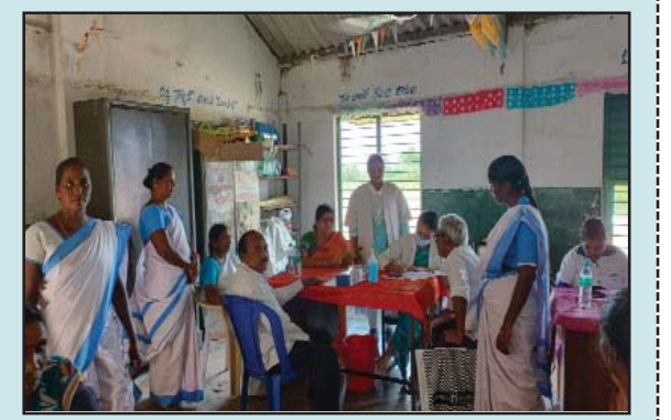
(షణ్ముఖ వెలుగు, దొరవారి సత్రం, అక్టోబర్ 4)

తిరుపతి జిల్లా దొరవారి సత్రం మండలం మిజారు గ్రామ సచివాలయం పరిధిలో స్విమ్ స్త్రీ బాలాజీ టిఎస్ డివై అఫ్ ఆంకాలజీ ఆధ్వర్యంలో శుక్రవారం తోగరాముడి పిహెచ్ఎస్ పరిధిలోని మిజారు గ్రామంలో సచివాలయం దగ్గర నిర్వహించిన ఉచిత క్యాన్సర్ స్క్రీనింగ్ కార్యక్రమానికి విశేష స్పందన లభించింది.