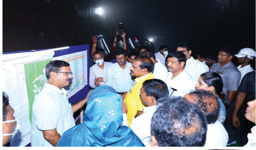
షణ్ముఖ వెలుగు, మార్కాపురం ఇన్‌ఛార్జి, అక్టోబర్ 29)