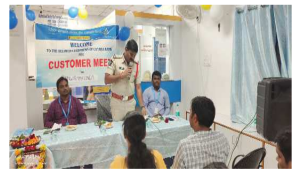
(షణ్ముఖ వెలుగు, సింగరాయకొండ, అక్టోబర్ 28)

బ్యాంక్ ఖాతాదారులకు సైబర్ నేరాలపై అవగాహన ఉండాలి కెనరా బ్యాంకులో ఖాతాదారులు అవగాహన కార్యక్రమంలో భాగస్వాములు కావాలి సీనియర్ బ్రాంచ్ మేనేజర్ పిలుపు