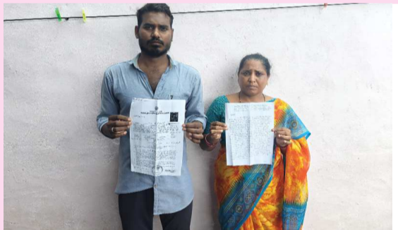
(షణ్ముఖ వెలుగు, చేజర్ల, అక్టోబర్ 28)