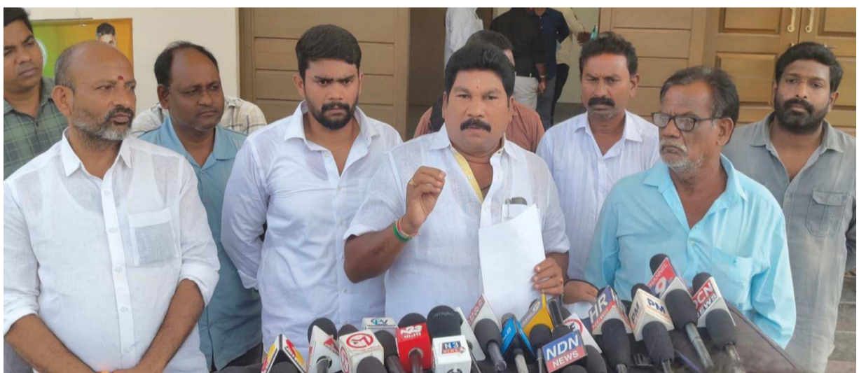
(షణ్ముఖ వెలుగు, నెల్లూరు, అక్టోబర్ 28)