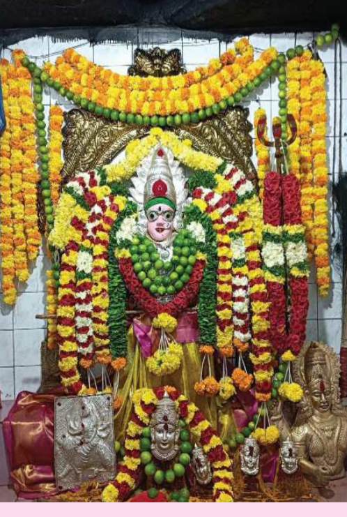
(షణ్ముఖ వెలుగు, మార్కాపురం టౌన్, అక్టోబర్ 27)

మార్కాపురం శివారులో వెలసిన శ్రీ అల్లూరి పోలీరమ్మ తల్లి భక్తులకు ప్రత్యేక అలంకరణలో దర్శనమిస్తున్నారు. ఆదివారం కావడంతో ఆలయ అర్చకులు అమ్మవారిని వివిధ రకాల పుష్పాలతో విశేషంగా ముస్తాబు చేశారు. శ్రీమహాకాళి, మహాలక్ష్మి, మహా నరసవతి, గ్రామరక్షకి అలంకరణలో భక్తులకు అల్లూరి పోలీరమ్మ తల్లి దర్శనమిస్తున్నారు. చుట్టూ పక్కల గ్రామాల ప్రజలు అమ్మవారిని దర్శించుకునేందుకు తరలివస్తున్నారు.