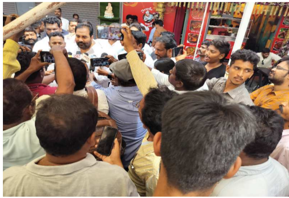
(షణ్ముఖ వెలుగు, నెల్లూరు, అక్టోబర్ 27)