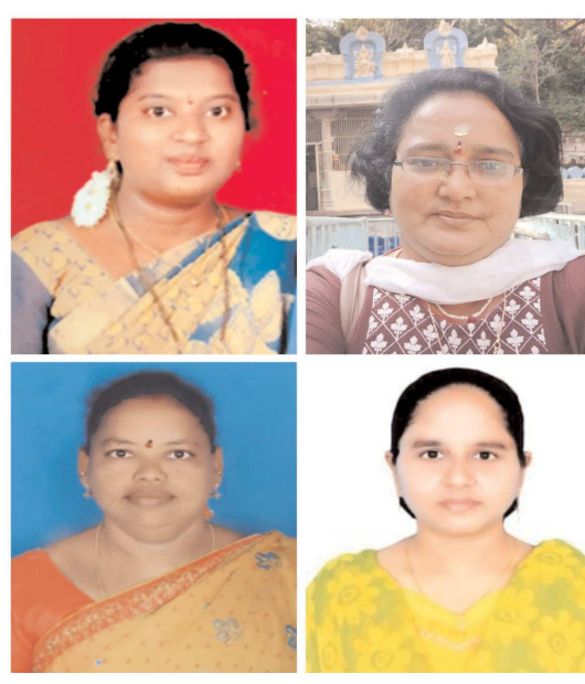
(షణ్ముఖ వెలుగు, నాయుడుపేట, అక్టోబర్ 24)