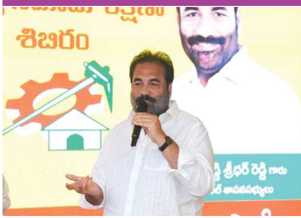
(షణ్ముఖ వెలుగు, నెల్లూరు, అక్టోబర్ 22)

నేటి సాయంత్రం నెల్లూరు రూరల్ ఎమ్మెల్యే కార్యాలయంలో తెలుగుదేశం పార్టీ సభ్యత్వ నమోదు శిక్షణా సదస్సు కార్యక్రమాన్ని నెల్లూరు రూరల్ ఎమ్మెల్యే కోటంరెడ్డి శ్రీధర్ రెడ్డి, టీడీపీ నాయకులు కోటంరెడ్డి గిరిధర్ రెడ్డి నిర్వహించారు. మాజీ ముఖ్యమంత్రి జగన్ మోహన్ రెడ్డిని కాదని, 16 నెలల ముందే అధికారాన్ని వదులుకొని వచ్చి నేను వద్ద బాధలు, ఇబ్బందులు అన్నీ జిల్లా ప్రజలకు తెలుసని రూరల్ ఎమ్మెల్యే కోటంరెడ్డి