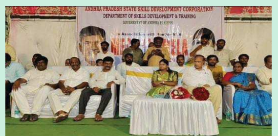
(షణ్ముఖ వెలుగు, సూళ్లూరుపేట ఇన్ ఛార్జ్, అక్టోబర్ 22)

మెగా జాబ్ మేళా కార్యక్రమంలో పాల్గొన్న ఎమ్మెల్యే