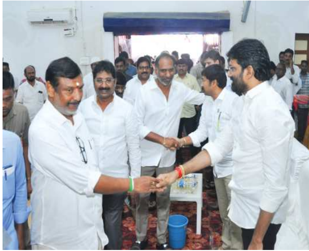
ప్రభుత్వసమితి, రోగుల ఇబ్బందులు తొలగించండి

రైతులకు అవసరమైన ఎరువులు అందించేలా చర్యలు చేపట్టాలి కందులకూరు ఎమ్మెల్యే ఇంటూరి కందులకూరు ఎమ్మెల్యే ఇంటూరు నాగేశ్వర రావు మాట్లాడుతూ, రైతులకు అవసరమైన ఎరువులను సకాలంలో అందించేలా వ్యవసాయ శాఖ అధికారులు చర్యలు చేపట్టాలన్నారు.