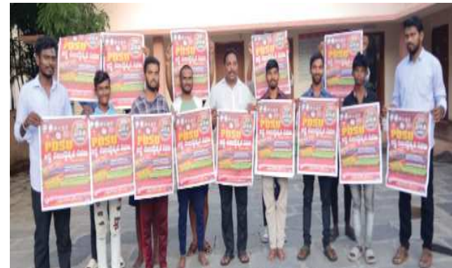
(షణ్ముఖ వెలుగు, ఒంగోలు, అక్టోబర్ 22)

విద్యారంగ సమస్యల పరిష్కారం కోసం, శాస్త్రీయ విద్యాసాధన కోసం 1974 లో ఏర్పడిన వీడిఎస్ యూ, 50 సంవత్సరాలూ గురవడం విద్యారంగ సమస్యల కోసం పోరాడుతూ, అనేక మంది విలువైన విద్యార్థి రత్నాలు ప్రాణాలు కోల్పోయారని వారి ఆడుగుజాడల్లో మరింత ముందుకు పోవాలని