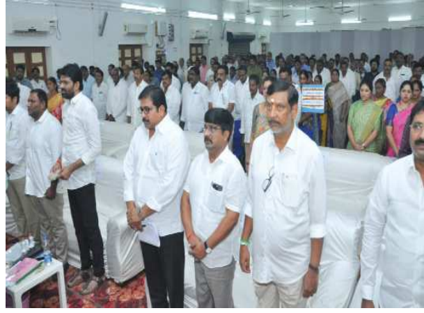
దర్శి నియోజక వర్గంలో పంట సప్తం అంచనాలు రూపొందించాలి

గిద్దలూరు ఎమ్మెల్యే ముత్తుముల అశోక్ రెడ్డి చిన్నపాటి వర్షానికి నూతనంగా నిర్మించిన గిద్దలూరు ప్రభుత్వ ఆసుపత్రి లీక్ అవుతుందని దీంతో రోగులు తీవ్ర ఇబ్బందులు పడుతున్నారని గిద్దలూరు ఎమ్మెల్యే ముత్తుముల అశోక్ రెడ్డి నమావేశం దృష్టికి తెచ్చారు. నాణ్యత లోపంతో గత ప్రభుత్వంలో కాంట్రాక్టర్ ఆసుపత్రి నిర్మాణం చేపట్టారన్నారు. నదరు కాంట్రాక్టర్ పై అధికారులు చర్యలు తీసుకోవాలని, అదే కాంట్రాక్టర్తో ఆసుపత్రి మరమ్మతులు చేపట్టాలని కోరారు. కలెక్టర్ కుడా ఆసుపత్రిని సందర్శించారని, అయినా ఎటువంటి మార్పు లేదన్నారు. గిద్దలూరు ప్రభుత్వ ఆసుపత్రిలో అంబులెన్సుకి కొత్తగా డ్రైవర్ కేటాయించాలన్నారు. ప్రస్తుతం అంబులెన్సు డ్రైవర్ రెండు నెలల్లో రిటర్న్ అవుతున్నారు. ప్రభుత్వ ఆసుపత్రిలో డ్రైవర్ కొరత ఉంది. అధికారులు దృష్టి సారించి ఆసుపత్రిలో డ్రైవర్ నిల్వలు పెంచాలన్నారు. మరో ముఖ్య డాక్టర్ని గిద్దలూరు ఆసుపత్రికి కేటాయించాలని, ఆసుపత్రిలో డాక్టర్స్ కొరత ఉందని, డిప్యూటీషన్ వెళ్లిన డాక్టర్స్ మళ్ళీ గిద్దలూరులో విధులు నిర్వహించే విధంగా అధికారులు చూడాలని ఆయన కోరారు.