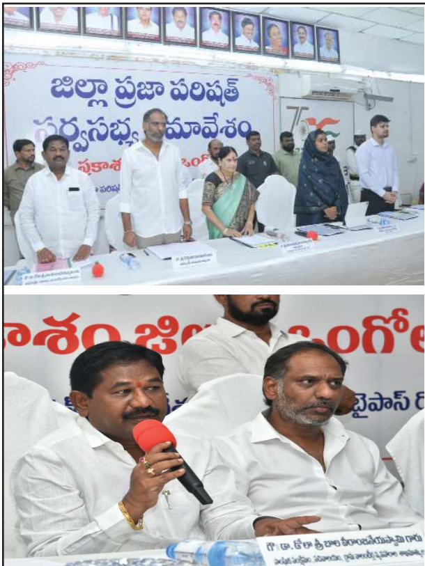
పెద్ద ఎత్తున చెక్ డ్యాంబు నిర్మాణాలు చేపట్టాలి

మార్కాపురం ఎమ్మెల్యే కందుల మార్కాపురం ఎమ్మెల్యే కందుల నారాయణ రెడ్డి మాట్లాడుతూ పశ్చిమ ప్రాంతంలో భూగర్భ జలాల మట్టం గణనీయంగా తగ్గిపోయాడని, భూగర్భ జలాల మట్టం పెరిగేలా నీటి సంరక్షణకు పెద్ద ఎత్తున చెక్ డ్యాంబుల నిర్మాణాలు చేపట్టాలని, చేపట్టిన చెక్ డ్యాంబుల పనులు త్వరగా పూర్తి చేసేలా చర్యలు తీసుకోవాలని కోరారు. ఇటీవల కురిసిన భారీ వర్షాల కారణంగా దెబ్బ తిన్న ప్రతి ఏకరాన్ని పరిశీలించి నష్టపోయిన రైతులకు నష్ట పరిహారం అందేలా చర్యలు తీసుకోవాలన్నారు.