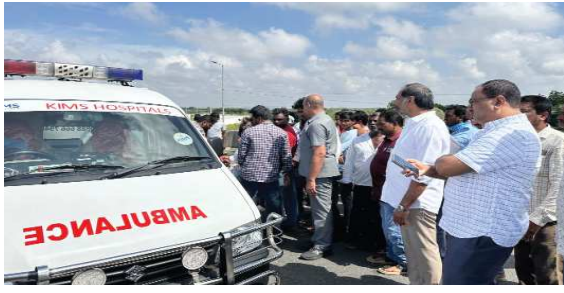
(షణ్ముఖ వెలుగు, ఒంగోలు, అక్టోబర్ 22)