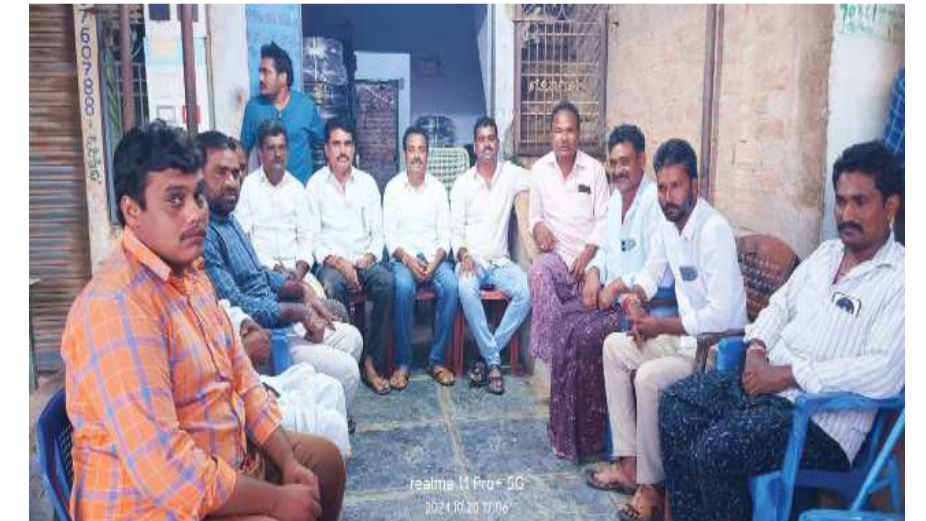
(షణ్ముఖ వెలుగు, పుల్లలచెరువు, అక్టోబర్ 20)

సర్పంచ్ పదవికి రాజీనామా చేస్తాను మండల టిడిపి కన్వీనర్ కి వైసీపీ సర్పంచ్ సత్తిరెడ్డి సవాల్ చేతనైతే సవాల్ స్వీకరించు లేదంటే మా ఎమ్మెల్యేని విమర్శించడం మానుకో