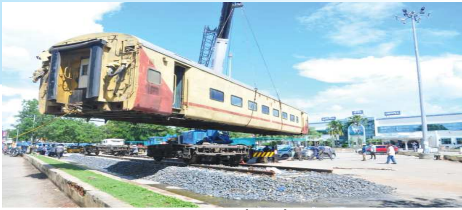
(షణ్ముఖ వెలుగు, ఒంగోలు, అక్టోబర్ 20)

రైలు ద్వారా కార్లు, లారీలు ఇలా అనేక రకాల వాహనాలను ఇతర ప్రదేశాలకు సరఫరా చేయడం సాధారణంగా చూస్తుంటాం... కానీ లారీ ద్వారా రైలును తరలించడం అరుదుగా చూస్తుంటాం... ఇటువంటి దృశ్యం ఒంగోలు పట్టణంలో ప్రజలను కనువిందు చేసింది. రైల్వే స్టేషన్ పరిసర ప్రాంతంలో ట్రయిన్ కంపార్ట్మెంట్ తో ఓ హెబాటల్ ను ఏర్పాటు చేయడం కోసం లారీ ద్వారా తీసుకువచ్చిన ట్రయిన్ కోచ్ ను నగర ప్రజలు ఆసక్తిగా తిలకించారు. వాహనం పై రైలు రావడం ఏంటి అంటూ అందరూ ఆశ్చర్యంతో ఆ దృశ్యాన్ని తమ నయనాలతో వీక్షించారు.