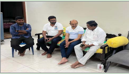
(షణ్ముఖ వెలుగు, పొదిలి, అక్టోబర్ 9)