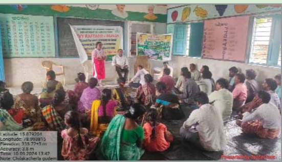
(షణ్ముఖ వెలుగు, పెద్ద దోర్నాల, అక్టోబర్ 9)