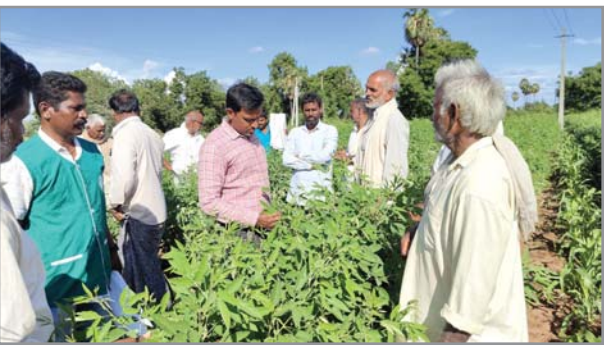
(షణ్ముఖ వెలుగు, మర్రిపాడి, అక్టోబర్ 9)