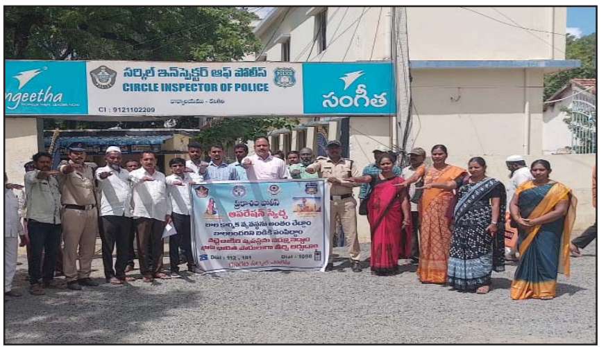
(షణ్ముఖ వెలుగు, ఒంగోలు, అక్టోబర్ 9)