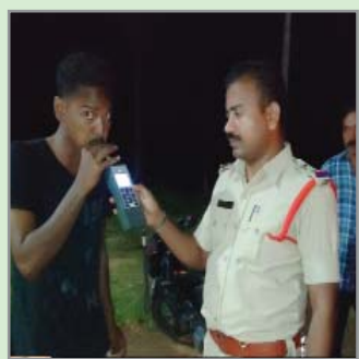
(షణ్ముఖ వెలుగు, హనుమంతపాడు, అక్టోబర్ 9)