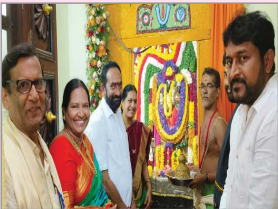
(షణ్ముఖ వెలుగు, మాచర్ల టౌన్, అక్టోబర్ 9)