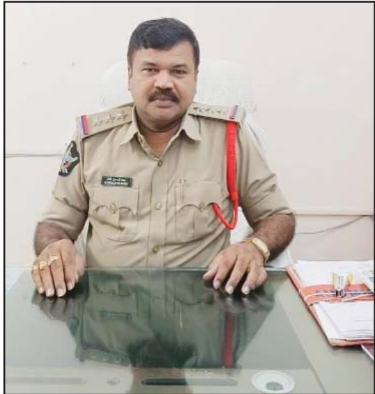
(షణ్ముఖ వెలుగు, మద్దిపాడు, అక్టోబర్ 9)