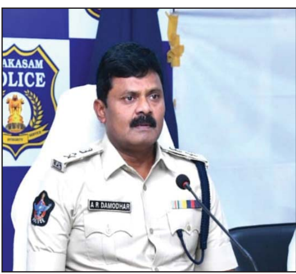
(షణ్ముఖ వెలుగు, ఒంగోలు, అక్టోబర్ 9) జిల్లాలో రోడ్డులు చేస్తే సహించలేదని జిల్లా ఎస్పీ ఏ ఆర్