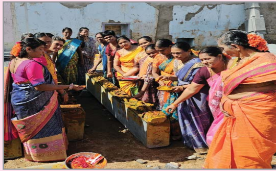
(షణ్ముఖ వెలుగు, కనిగిరి, అక్టోబర్ 9)