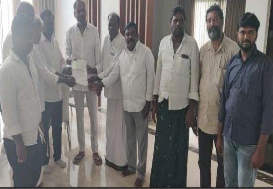
(షణ్ముఖ వెలుగు, కొరిశపాడు, సెప్టెంబర్ 11)