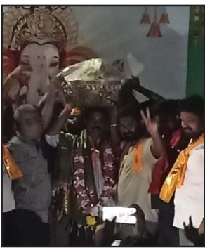
(షణ్ముఖ వెలుగు, గిద్దలూరు, సెప్టెంబర్ 11)