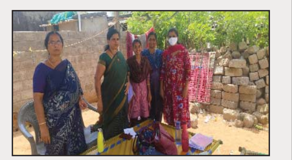
(షణ్ముఖ వెలుగు, ఉలపాడు, సెప్టెంబర్ 11)