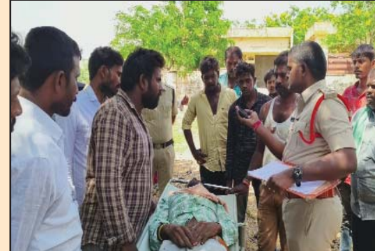
(షణ్ముఖ వెలుగు, మార్కెట్ అండ్ డ్రాఫ్ట్, సెప్టెంబర్ 11)