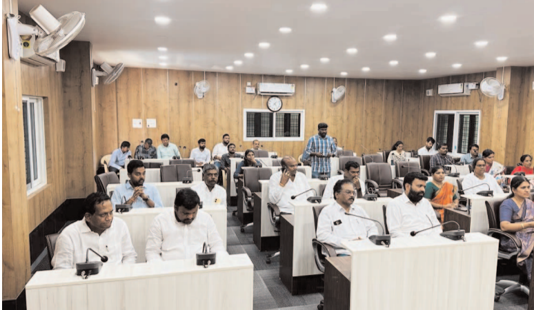
ఇబ్బంది లేకుండా చూడాలి.