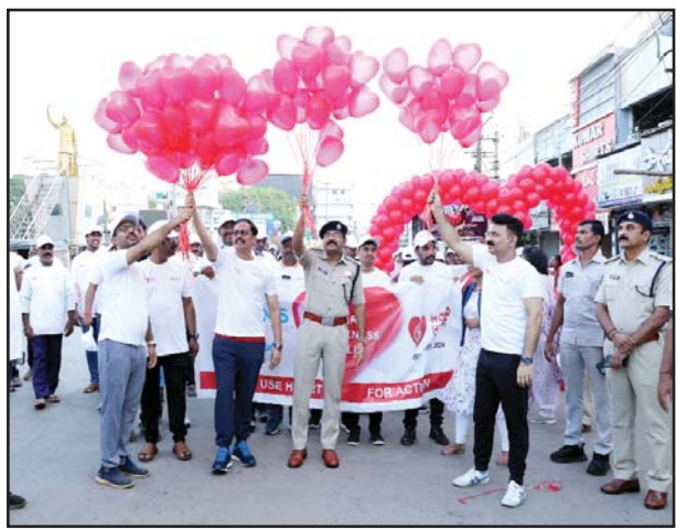
(షణ్ముఖ వెలుగు, నెల్లూరు, సెప్టెంబర్ 29) జిల్లా పోలీస్ శాఖ, అపోలో హాస్పిటల్ వారి ఆధ్వర్యంలో ప్రపంచ హృదయ దినోత్సవం సందర్భంగా కేబీఆర్ జంక్షన్ నుండి ఉషేష్ చంద్ర కాన్ఫరెన్స్ హాల్ వరకు అవగాహన రాల్చి నిర్వహించారు. అనంతరం మెడికల్ క్యాంప్ ను ప్రారంభించి, స్వయంగా పరీక్షలు యిచ్చి చేయించుకున్నారు. సైవల్స్ దాక్టర్ చే పలు వైద్య పరీక్షలు నిర్వహించారు. కార్యక్రమంలో పోలీసు అధికారులు, సిబ్బంది పాల్గొన్నారు. నిత్యం ప్రజల సేవకే అంకితమైన పోలీస్ సిబ్బంది ఆరోగ్య