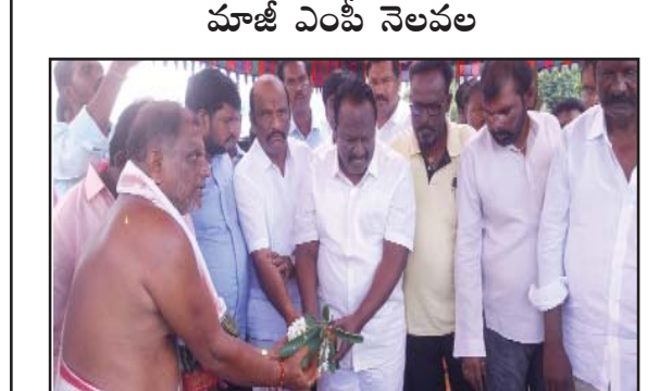
(షణ్ముఖ వెలుగు, సూర్యారావుపేట ఇంచార్జి, సెప్టెంబర్ 29)