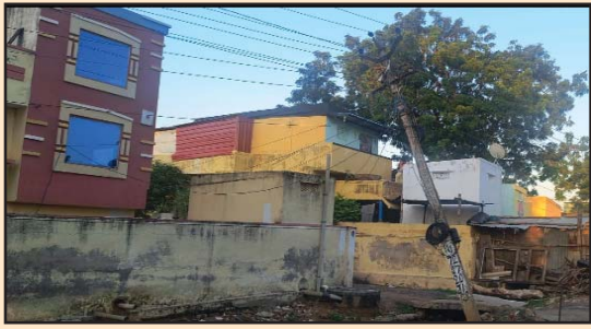
(షణ్ముఖ వెలుగు, ఉలవపాడు, సెప్టెంబర్ 29)

మండల కేంద్రమైన ఉలవపాడు అంబేద్కర్ నగర్ గోపాల్ రెస్ మిల్ పరిసర ప్రాంతంలో గత కొన్ని నెలలుగా విద్యుత్ స్తంభం వరిగి ప్రమాద స్థితిలో ఉన్నా చూసి చూడనట్లు వ్యవహారాన్ని తాత్కాలిక మరమ్మత్తుతో కాలయాపన చేస్తున్న విద్యుత్ అధికారులు వర్షాకాల సమయంలో స్తంభం ఒరిగినందువల్ల విద్యుత్ వైర్లు షార్ట్ అయ్యి మంటలు చెల రేగుతున్నందువల్ల చుట్టూప్రక్కల ప్రజలు భయాందోళనకు గురి అవుతున్నారు. ఇకనైనా విద్యుత్ అధికారులు నిద్రమత్తు వీడి పాత విద్యుత్ స్తంభానికి బదులుగా నూతన స్తంభాన్ని నిర్మించి సరి చేయవలెనని చుట్టూ ప్రక్కల ప్రజలు కోరుతున్నారు.