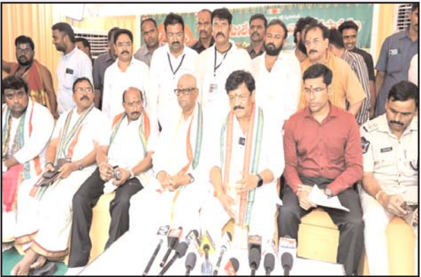
(షణ్ముఖ వెలుగు, వెంకటగిరి, సెప్టెంబర్ 26)

వెంకటగిరి పోలేరమ్మ అమ్మవారికి రాష్ట్ర ప్రభుత్వం తరఫున గురువారం పట్టు వస్త్రాలను రాష్ట్ర పర్యాటక శాఖ మంత్రి కందుల దుర్గేష్ సమర్పించి అమ్మవారిని రాష్ట్ర దేవదాయ శాఖ మంత్రి ఆనం రామనారాయణరెడ్డితో కలిసి దర్శించుకున్నారు. ఈ సందర్భంగా ఆలయానికి చేరుకున్న మంత్రులకు ఘనంగా స్వాగతం లభించింది. అనంతరం అమ్మవారి ఆలయంలో ప్రత్యేక పూజలు చేసి మంత్రులకు ఆలయ అధికారులు ప్రత్యేక దర్శనం చేయించారు. దర్శనం అనంతరం ఆలయ అర్చకులు అమ్మవారి తీర్థ ప్రసాదాలు అందజేసి వేదమంత్రాలతో ఆశీర్వాదనం పలికారు. దేవదాయ శాఖ మంత్రి మాట్లాడుతూ ఇటీవల కాలంలో వెంకటగిరి ఎమ్మెల్యే ఆంధ్రప్రదేశ్ రాష్ట్ర ముఖ్యమంత్రిని కలిసి పోలేరమ్మ జాతరకు మీరు రావాలి, గతంలో రాష్ట్ర పండుగగా నిర్ణయం చేసారు కాని ప్రభుత్వం ఎలాంటి సహాయ సహకారాలు లేవని, మీ రాకతో పాటు ఈ జాతర బాగా జరిగేందుకు ఆర్థికంగా నిధులు కూడా సమకూర్చమని అడగడం జరిగిందని తెలిపారు. ముఖ్యమంత్రి దేవదాయ శాఖ మంత్రిగా ఉన్న సన్ను దేవదాయ శాఖాధికారులను పిలిచి, రాష్ట్రంలో ఉన్నటువంటి అన్ని ఆధ్యాత్మిక కేంద్రాల్లో రాష్ట్రంలో ఇప్పటి వరకు ఆరు పండుగలను మాత్రమే ప్రభుత్వం గుర్తించిందని, దీనికి మరొక రెండు పండుగలు శ్రీకాకుళం జిల్లాలోని కోట బొమ్మలి, పశ్చిమ గోదావరి జిల్లా పెనుగొండలో ఉన్నటువంటి కన్యకా పరమేశ్వరి ఆలయంలో జరిగే