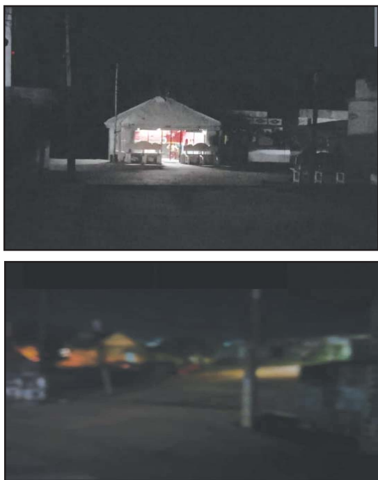
(షణ్ముఖ వెలుగు, ఉలవపాడు, సెప్టెంబర్ 26)

ఉలవపాడు మండల పరిధిలోని చాగల్లు గ్రామ పంచాయతీ ఇందిరానగర్ కాలనీలో గత పది రోజులుగా వీధిలైట్లు వెలగడం లేదు. అక్కడ కుక్కల బెడద పాములు బెడద ఎక్కువగా ఉండటంతో రాత్రిపూట ఆడవాళ్లు పిల్లలు బయట తిరగాలంటే భయభ్రాంతులకు గురి అవుతున్నారు. గతంలో కొంతమంది పాము పాటు కూడా గురి అయినారు. స్థానిక ప్రజలు ఎన్నిసార్లు పంచాయతీ వారికి విన్నవించుకున్నా పట్టించుకోని ఆనవాలు కనబడలేదు. ఇకనైనా పంచాయతీ అధికారులు మేలకొని వీధి దీపాలు వెలిగేటట్లు చేసి సమస్యను పరిష్కరించవలసిందిగా స్థానిక ప్రజలు కోరుకుంటున్నారు.