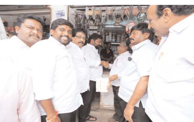
(షణ్ముఖ వెలుగు, నెల్లూరు, సెప్టెంబర్ 26)

నెల్లూరు రూరల్ నియోజకవర్గ పరిధిలోని 19వ డివిజన్ రామలింగాపురం సెంటర్లో ఇది మంచి ప్రభుత్వం కార్యక్రమంలో భాగంగా ఇంటింటికి తిరిగి ప్రభుత్వం చేస్తున్న మంచి కార్యక్రమాలను డిడిపి నాయకులు కోటంరెడ్డి గిరిధర్ రెడ్డి వివరించారు. 3000 రూపాయల పెన్షన్ ను 4000 రూపాయలు చేసి ఒకటో తేదీ ఇంటింటికి వచ్చి పెన్షన్ ను అందిస్తున్న ఘనత చంద్రబాబు నాయుడు కి దక్కతుందన్నారు డిడిపి నాయకులు కోటంరెడ్డి గిరిధర్ రెడ్డి. పేదోళ్ల ఆకలిని తీర్చే అన్నా క్యాంపేన్ ను తిరిగి ప్రారంభించిన ఘనత ముఖ్యమంత్రి చంద్రబాబు నాయుడు ది అని డిడిపి నాయకులు కోటంరెడ్డి గిరిధర్ రెడ్డి అన్నారు. ప్రజల నుంచి సూచనలు, సలహాలు తీసుకుంటాం. పేదల ఆకలి తీర్చేందుకే 5 రూపాయలకే అన్న క్యాంపేన్ను ప్రారంభించామన్నారు.