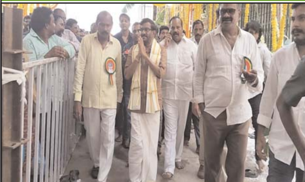
(షణ్ముఖ వెలుగు, నెల్లూరు, సెప్టెంబర్ 26)