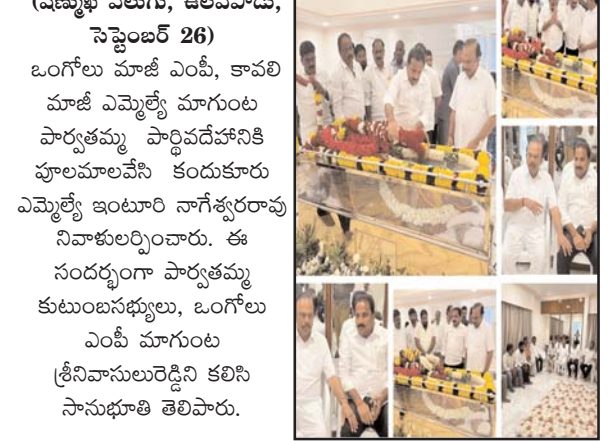
(షణ్ముఖ వెలుగు, ఉలవపాడు, సెప్టెంబర్ 26)

ఓంగోలు మాజీ ఎంపీ, కావలి మాజీ ఎమ్మెల్యే మాగుంట పార్వతమ్మ పార్లమెంటులోని నివాళులర్పించారు. ఈ సందర్భంగా పార్వతమ్మ కుటుంబసభ్యులు, ఓంగోలు ఎంపీ మాగుంట శ్రీనివాసులరెడ్డిని కలిసి సానుభూతి తెలిపారు.