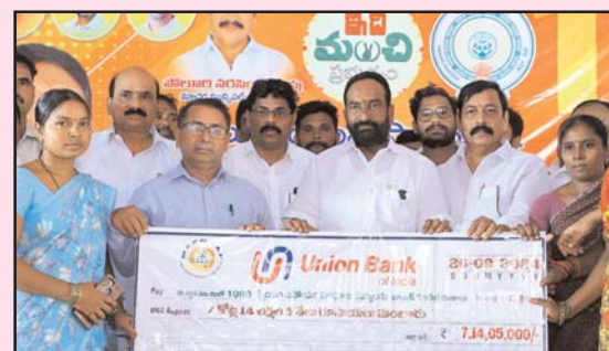
(షణ్ముఖ వెలుగు, మాచర్ల టౌన్, సెప్టెంబర్ 26)