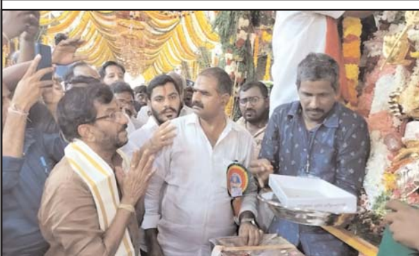
(షణ్ముఖ వెలుగు, నెల్లూరు, సెప్టెంబర్ 26)