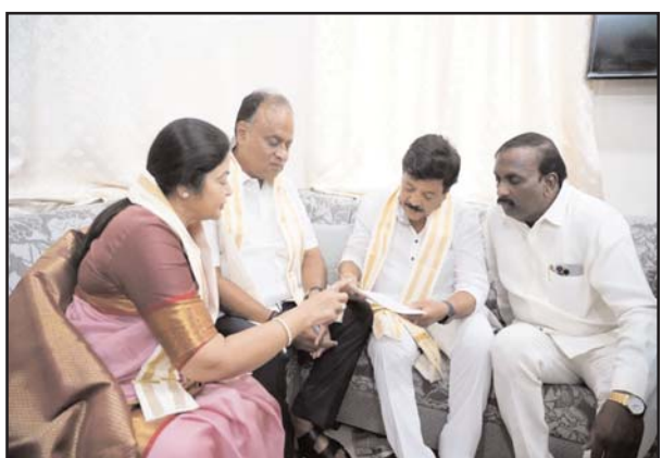
(షణ్ముఖ వెలుగు, కోవూరు, సెప్టెంబర్ 26)