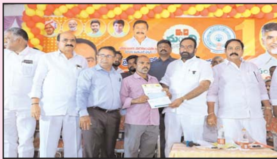
(షణ్ముఖ వెలుగు, మాచర్ల టౌన్, సెప్టెంబర్ 26)