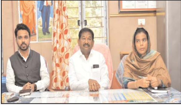
(షణ్ముఖ వెలుగు స్టాఫ్ రిపోర్టర్, ఒంగోలు, సెప్టెంబర్ 26)