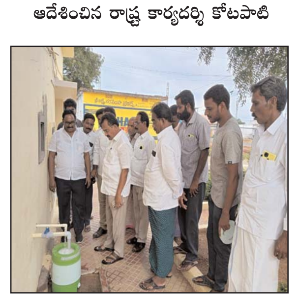
(షణ్ముఖ వెలుగు, పాపూరు, సెప్టెంబర్ 26)