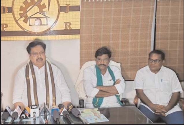
(షణ్ముఖ వెలుగు, ఒంగోలు, సెప్టెంబర్ 26)